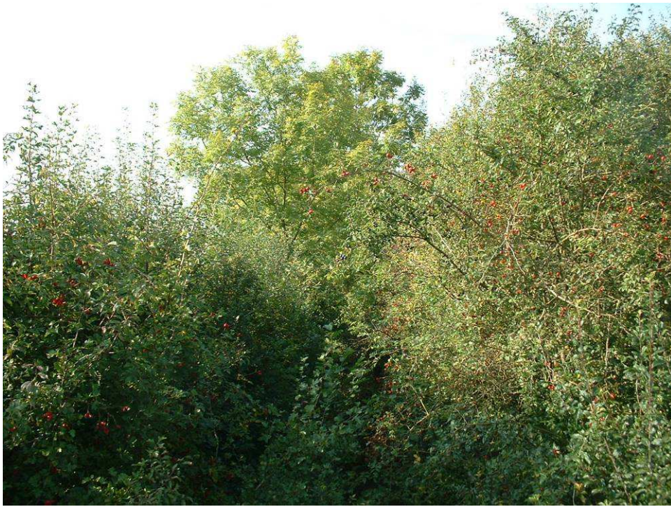
Intervention mécanique sur la ripisylve pour dégager le lit mineur