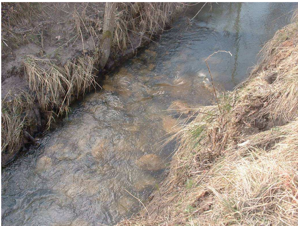
Mise en place d'un radier courant pour diversifier les écoulements et permettre un recharge du substrat en amont.