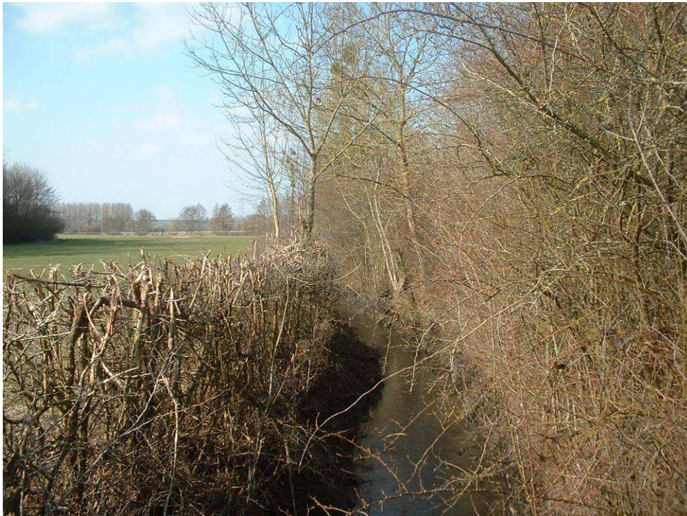
Dégagement du lit mineur