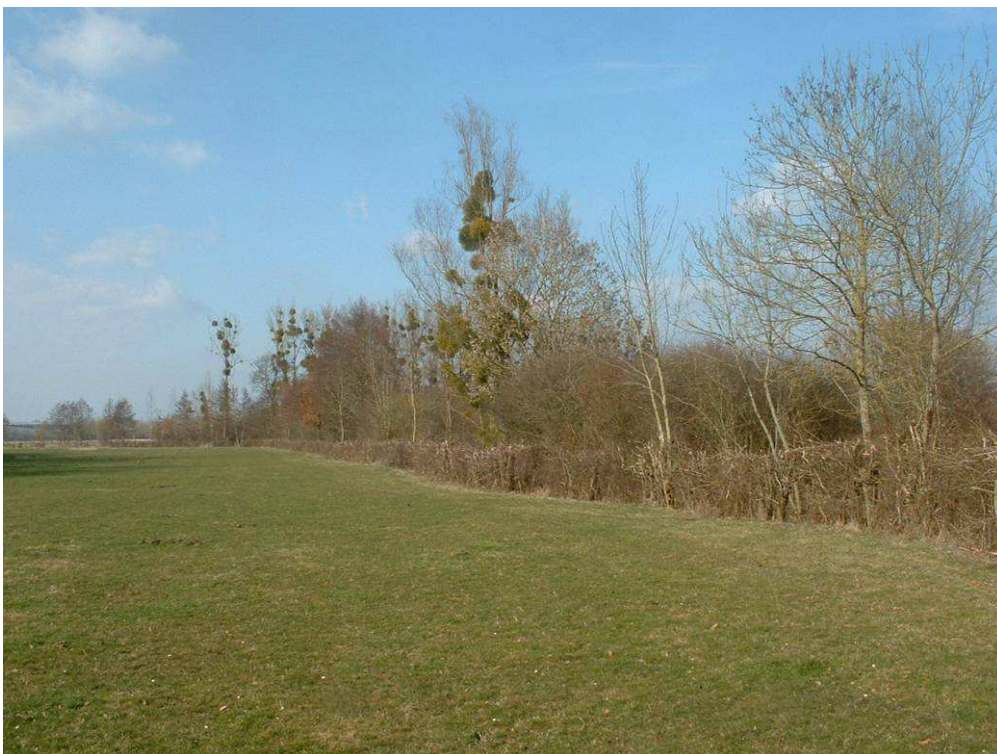
Traitement en haie et conservation des haut jets