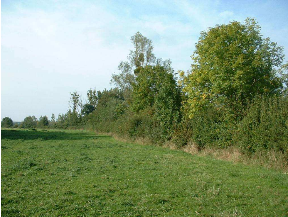
Intervention mécanique pour entretenir la haie ripisylve