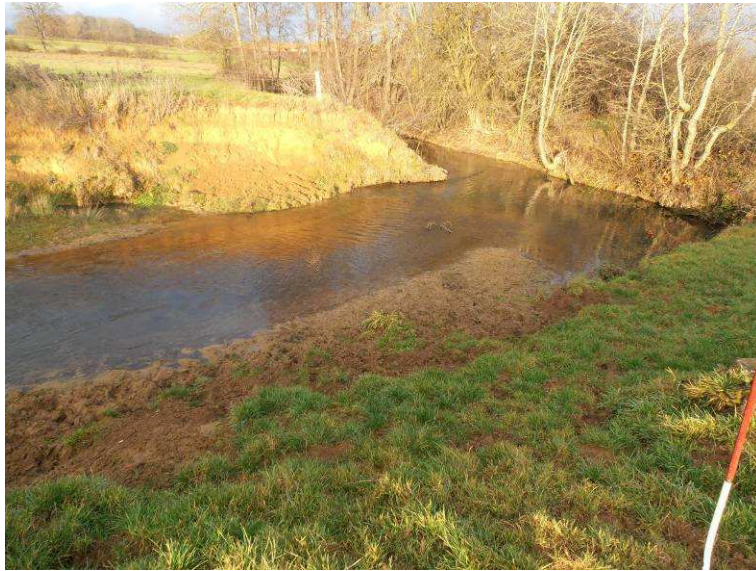
Présence de berges érodées ou dénudées de végétation sur lesquelles il est prévu de mettre en place des boutures afin de limiter le phénomène d'érosion.