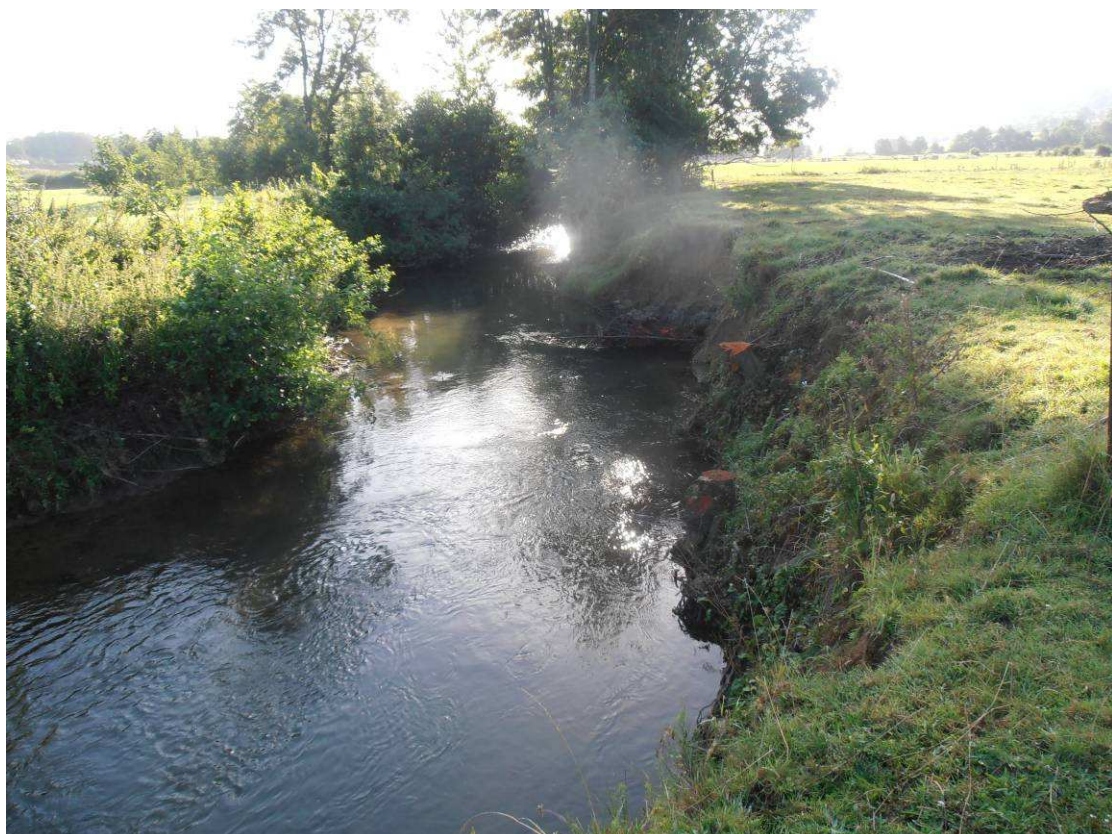
Coupe et extraction des arbres couchés dans la rivière et créant un encombre à l'écoulement.