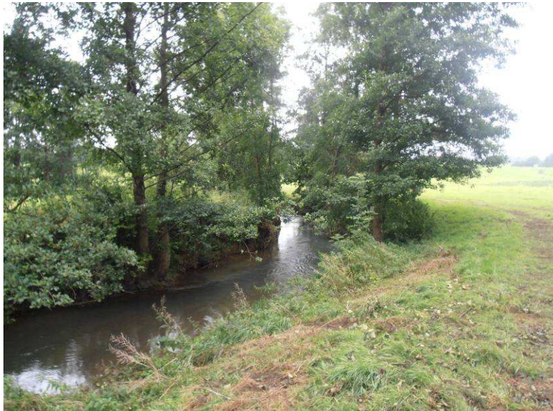
Coupe et extraction.