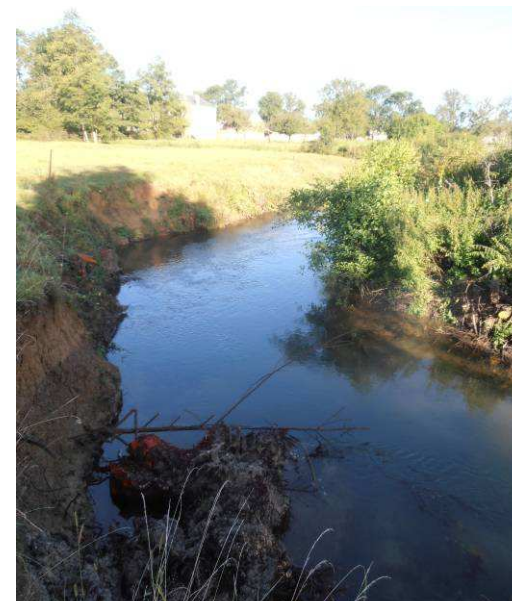
Coupe et extraction des arbres et déplacement de la souche afin de limiter l'impact érosif de la rivière sur la berge.