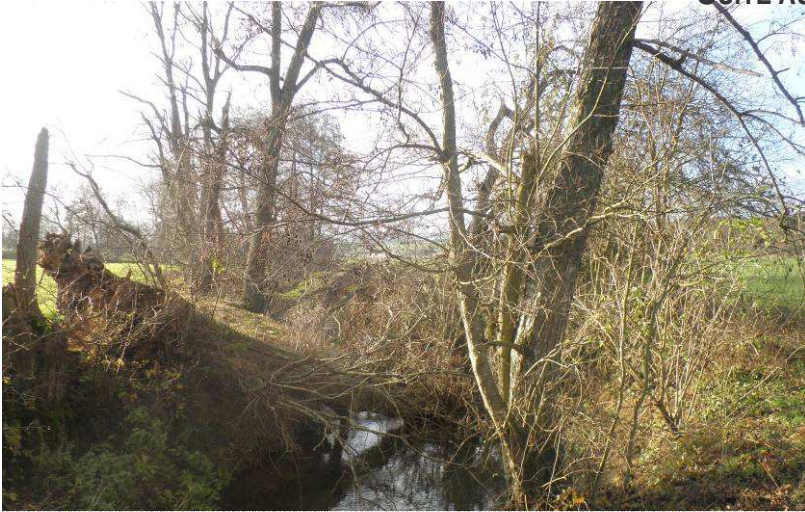
Arbre couché dans la rivière ou éclaté suite au passage de la tempête à l'été 2011.