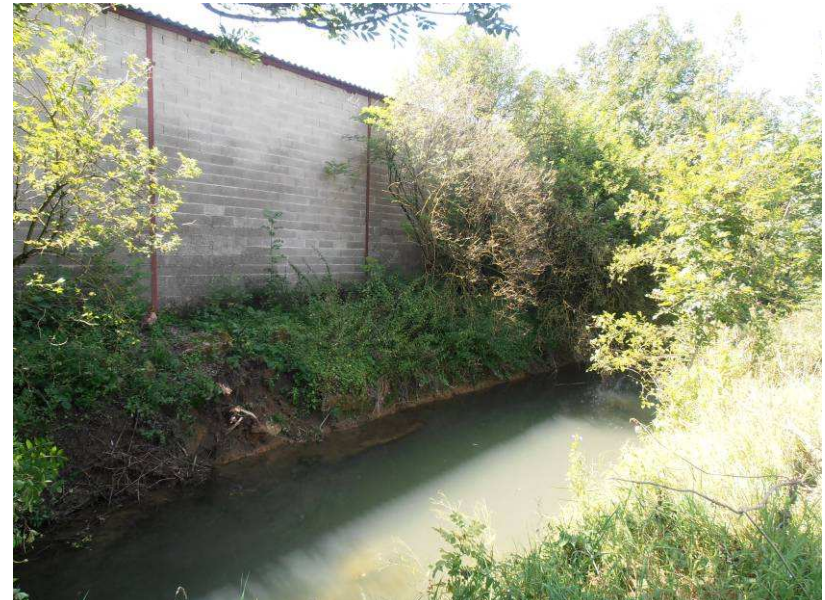
Coupe et extraction.