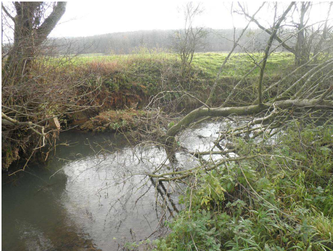
Aulne et frêne dont la souche a été emportée dans le lit de la rivière et qui a contraint l'arbre à se coucher sur le cours d'eau.