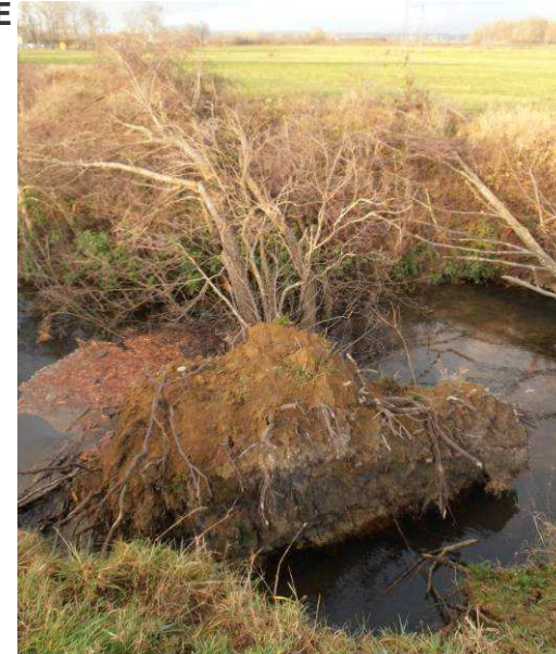
Arbres déracinés et présence de souche dans l'eau créant une encoche d'érosion dans la berge