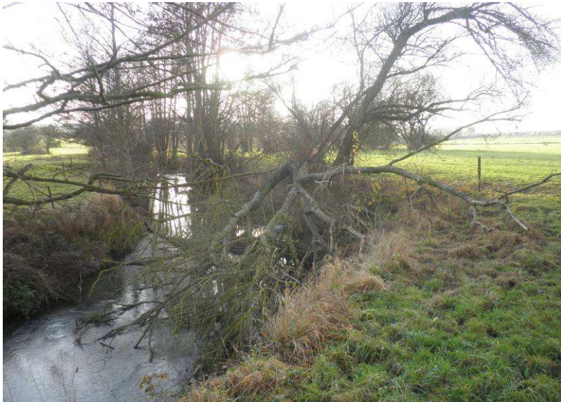
Arbre couché dans la rivière ou éclaté suite au passage de la tempête à l'été 2011.