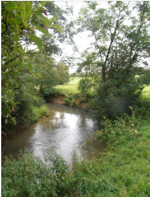
Coupe et extraction.