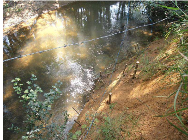
Mise en place de bouturages de saules blancs