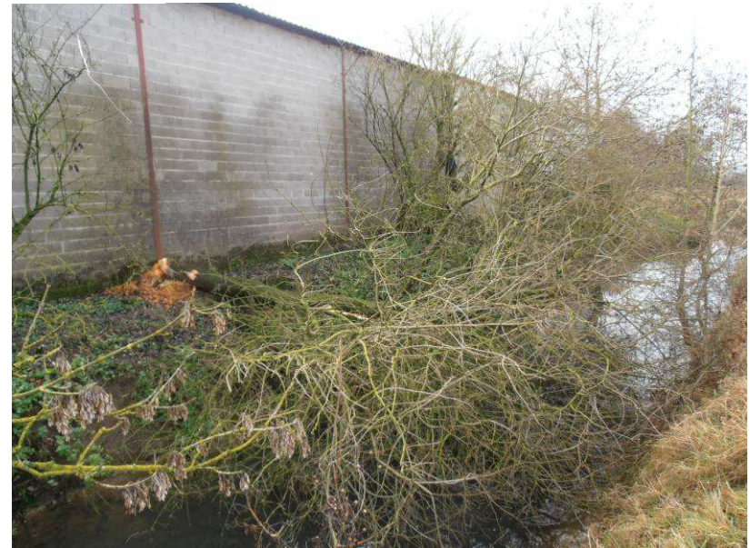
Arbre couché dans la rivière suite au passage de castors.