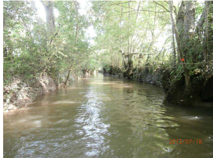
Avant : Présence de végétation buissonnante (saule principalement ainsi que de l'aubépine, prunellier, érable...) recouvrant le lit de la rivière. Après : Coupe de la végétation buissonnante et apport de lumière par réouverture du milieu.