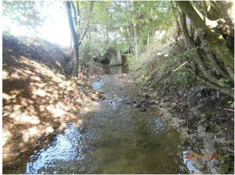
Réalisation 2012 : confection d'un radier pour compenser la chute du pont et faciliter le franchissement de l'obstacle