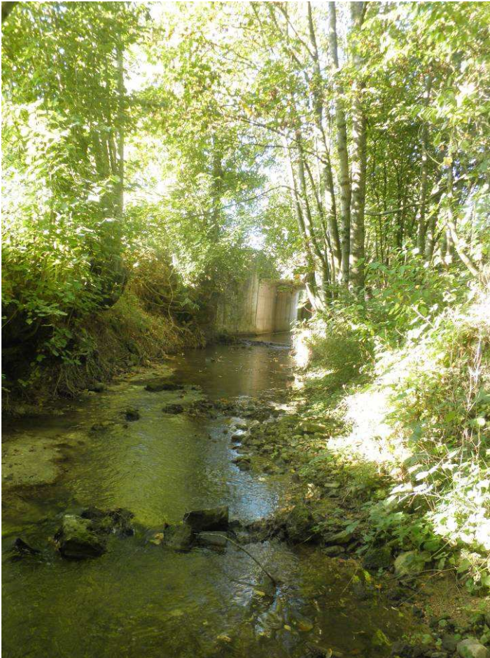
Constat 2011 : Zone aval du pont de la RD 21. Observation d'une chute au niveau du radier du pont.