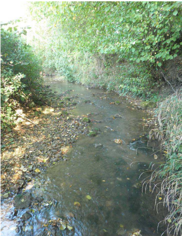
Constat 2011 : Zone de radier existante à conserver et à rallonger.