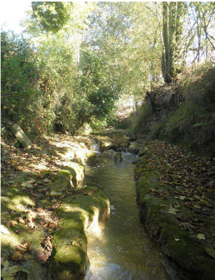
Constat 2011 : Zone de chenal décapée