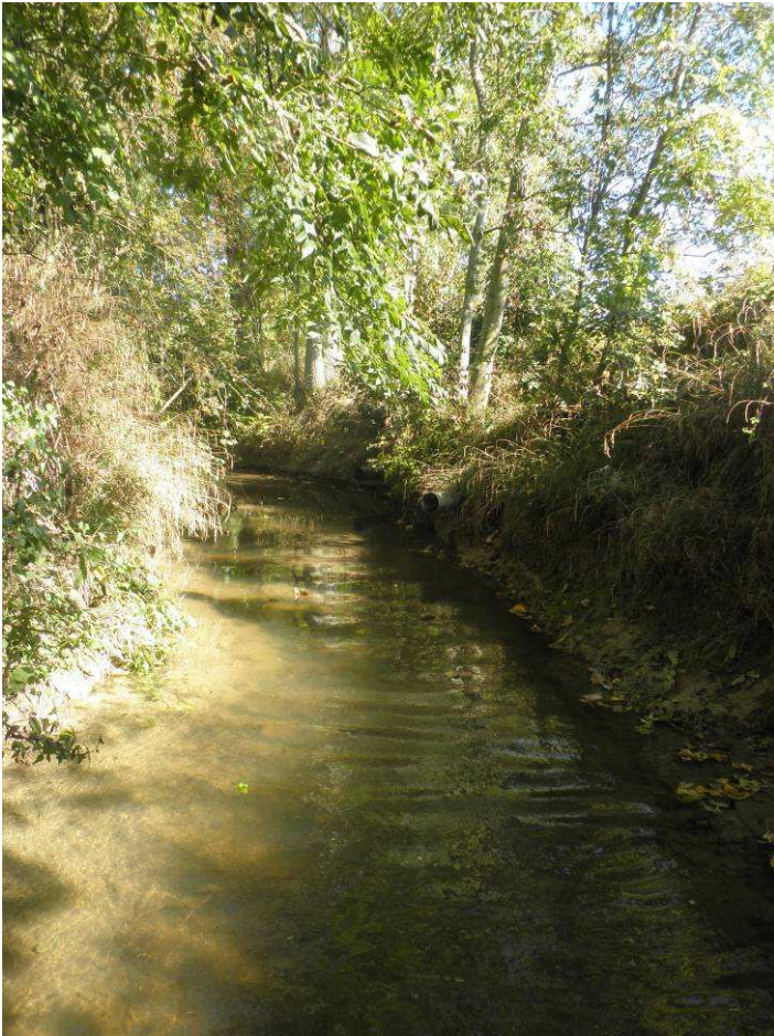
Constat 2011 : Zone de surlargeur avec homogénéité du milieu