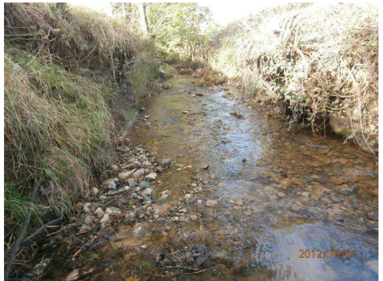
Réalisation 2012 : Maintien du radier et prolongement de celui-ci sur 5m