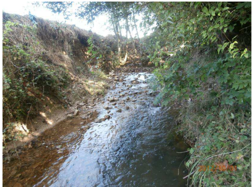
Réalisation 2012 : confection d'un radier ou seuil de fonds (suivant les cas) afin de limiter l'engraissement du lit et faciliter la recharge sédimentaire du cours d'eau.