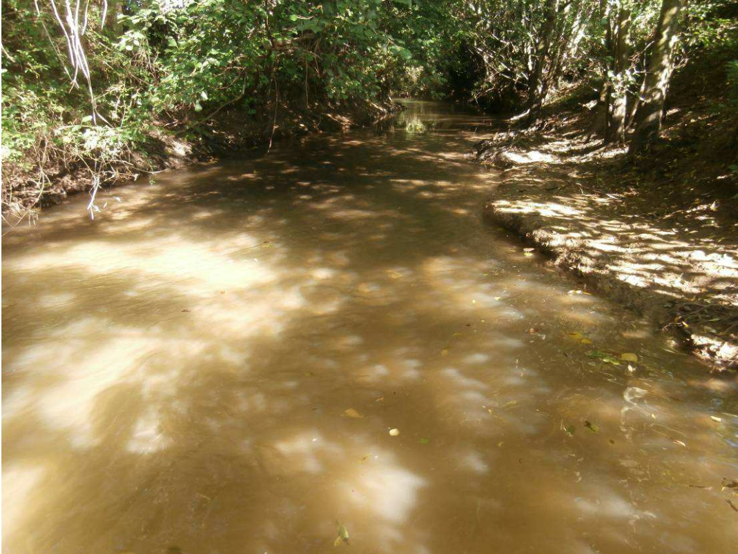
Observation d'une banquette d'argile en rive droite : création d'un seuil de fond afin de limiter l'érosion du lit et permettre le blocage du substrat