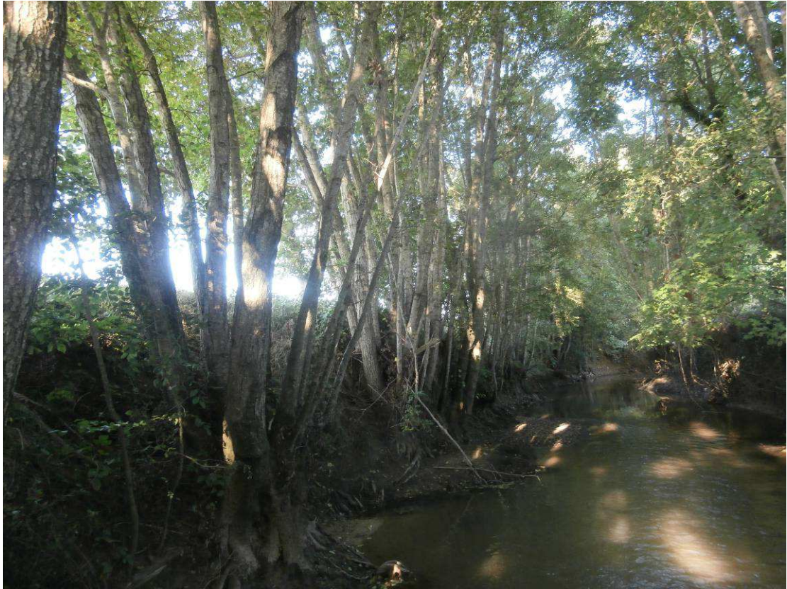
Cépées d'aulnes implantées en pied de berge. Sélection dans les brins à réaliser