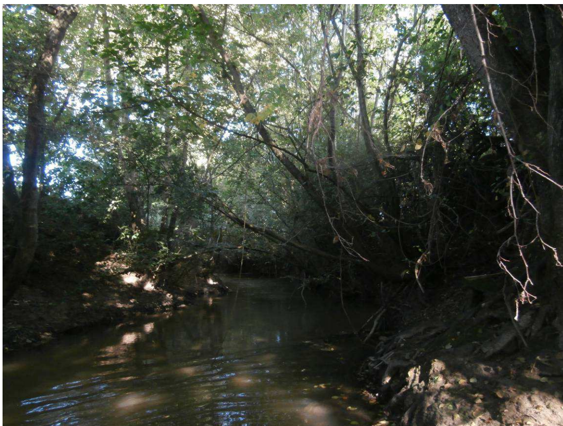
Végétation buissonnante perchée retombant dans le lit de la rivière. A Couper et extraire