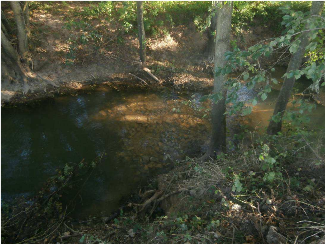
Réalisation d'un seuil de fond afin de permettre de bloquer le substrat « lessivé ».