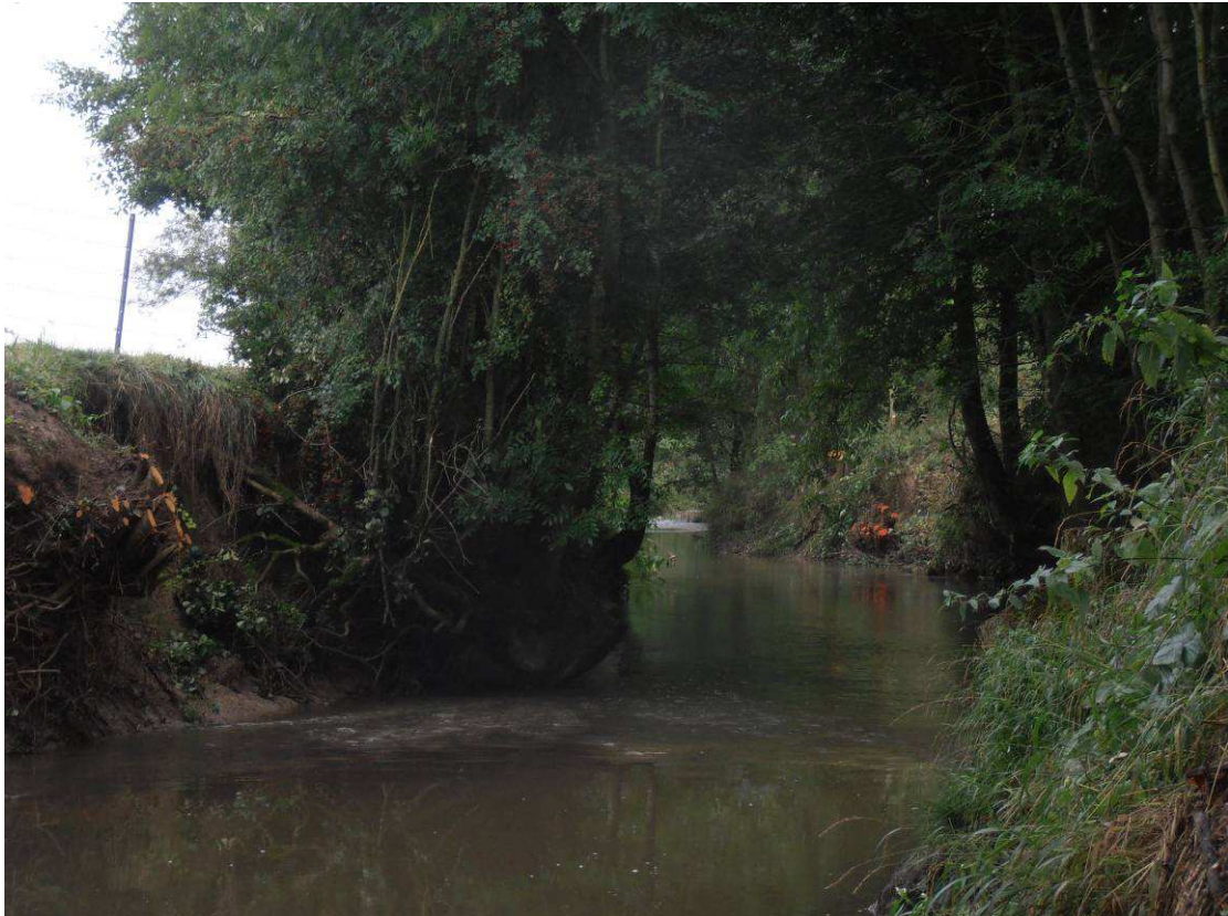
Réalisation de sélection dans les cépées afin de rouvrir le milieu tout en conservant un aspect de voûte.