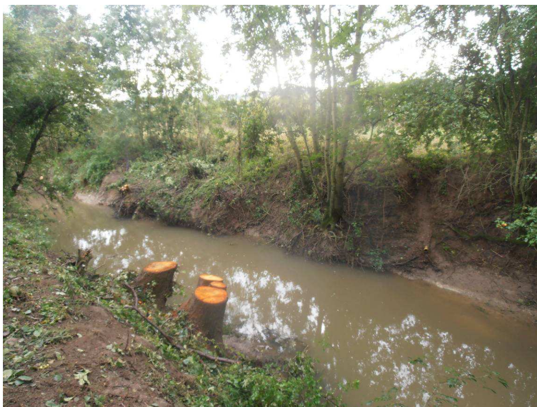
Coupe des buissonnants ainsi que de quelques aulnes afin de rouvrir le milieu et extraire les sujets ayant chutés dans le lit.