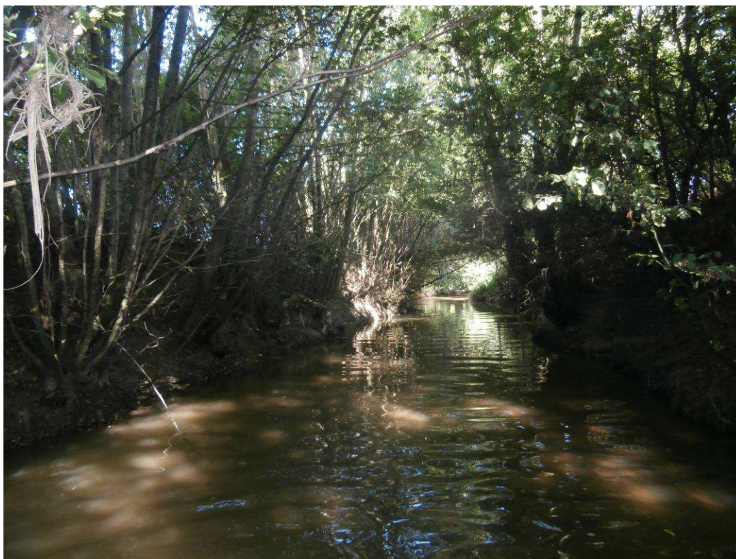
Secteur homogène à diversifier par la mise en place de blocs en alternance