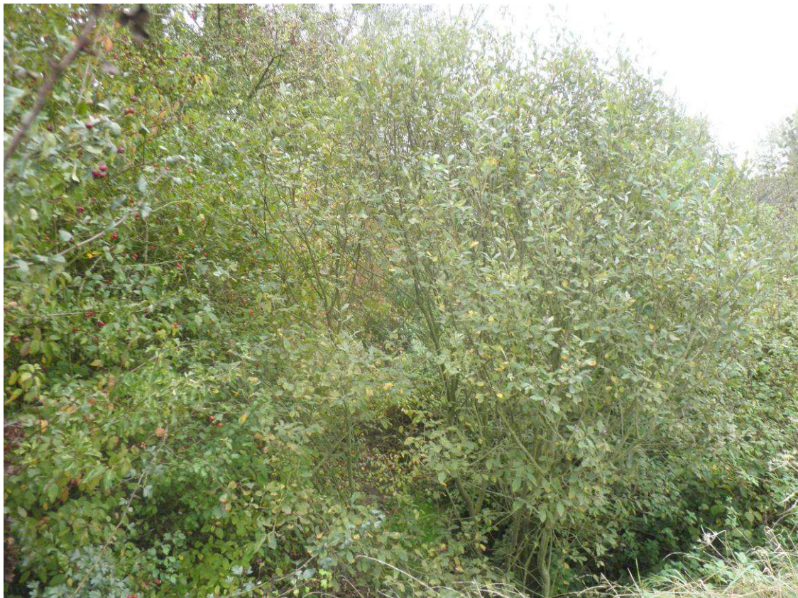
Milieu fermé et colonisé par de la végétation buissonnante (aubépine, prunellier, saule...) et quelques jeunes arbrisseaux.