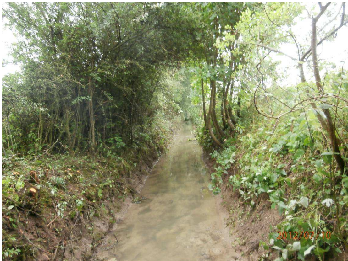
Réouverture du milieu par coupe de la végétation buissonnante recouvrant le milieu et conservation d'un aspect voûte.