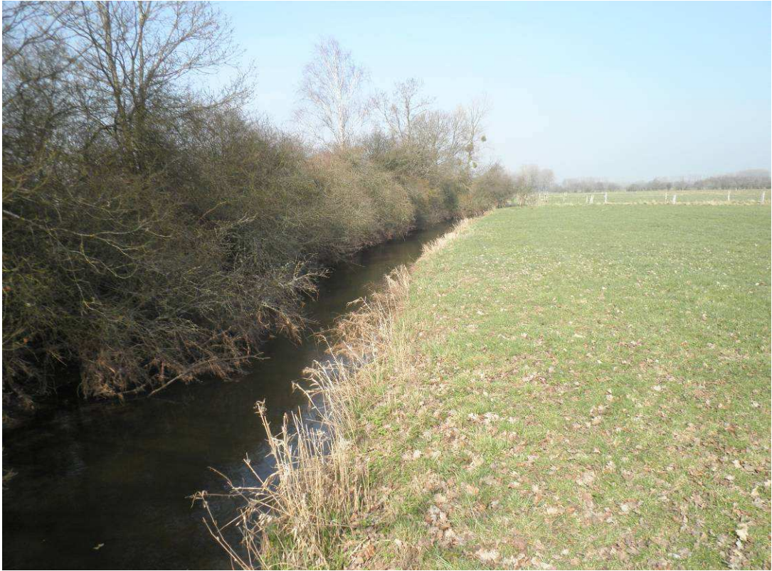
Présence de buissonnants importante recouvrant la rivière et augmentant le risque d'encombres.