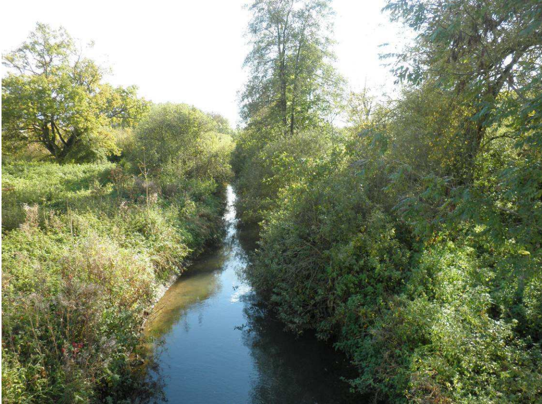
Prise de vue réalisée sur le pont entre Brioules et Châtillon / bar avant le démarrage du chantier. Recouvrement de la rivière par de la végétation buissonnante.