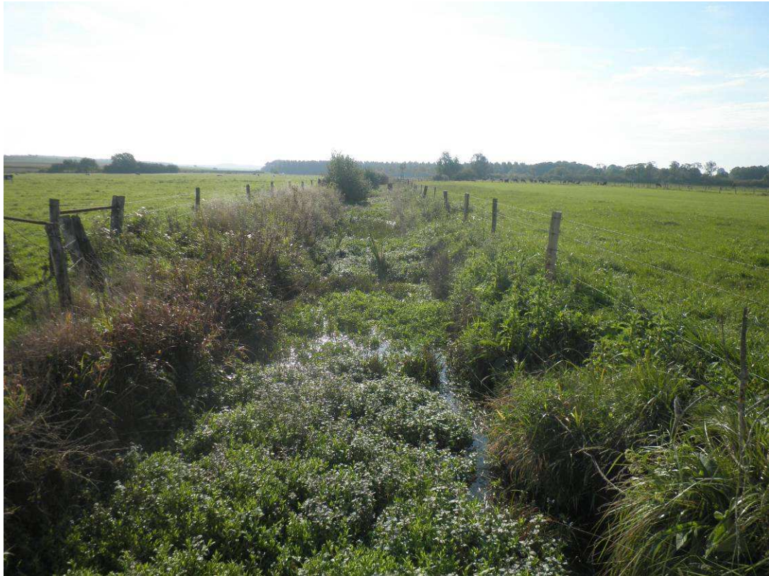
Colonisation du canal Marat par le cresson.