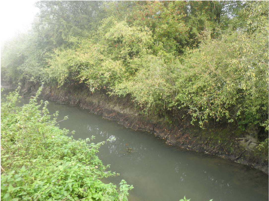
Coupe des branchages bas des végétaux buissonnants.