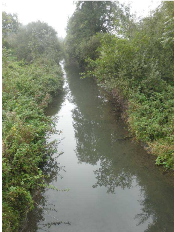
Prise de vue réalisée à la fin du chantier. Réouverture du milieu et facilitation de l'écoulement.