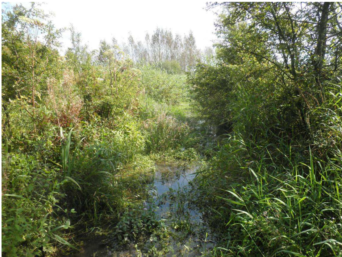
Le ruisseau des Aulnois. Présence de cresson recouvrant la quasi-totalité du cours d'eau.