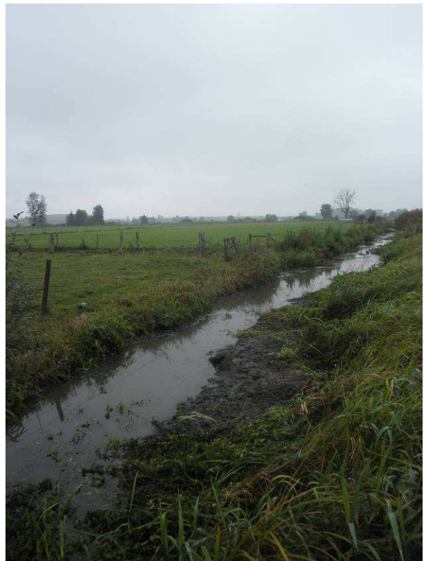
Réalisation de banquettes avec le cresson afin limiter la progression de l'espèce mais également dynamiser le cours d'eau en diversifiant les écoulements.