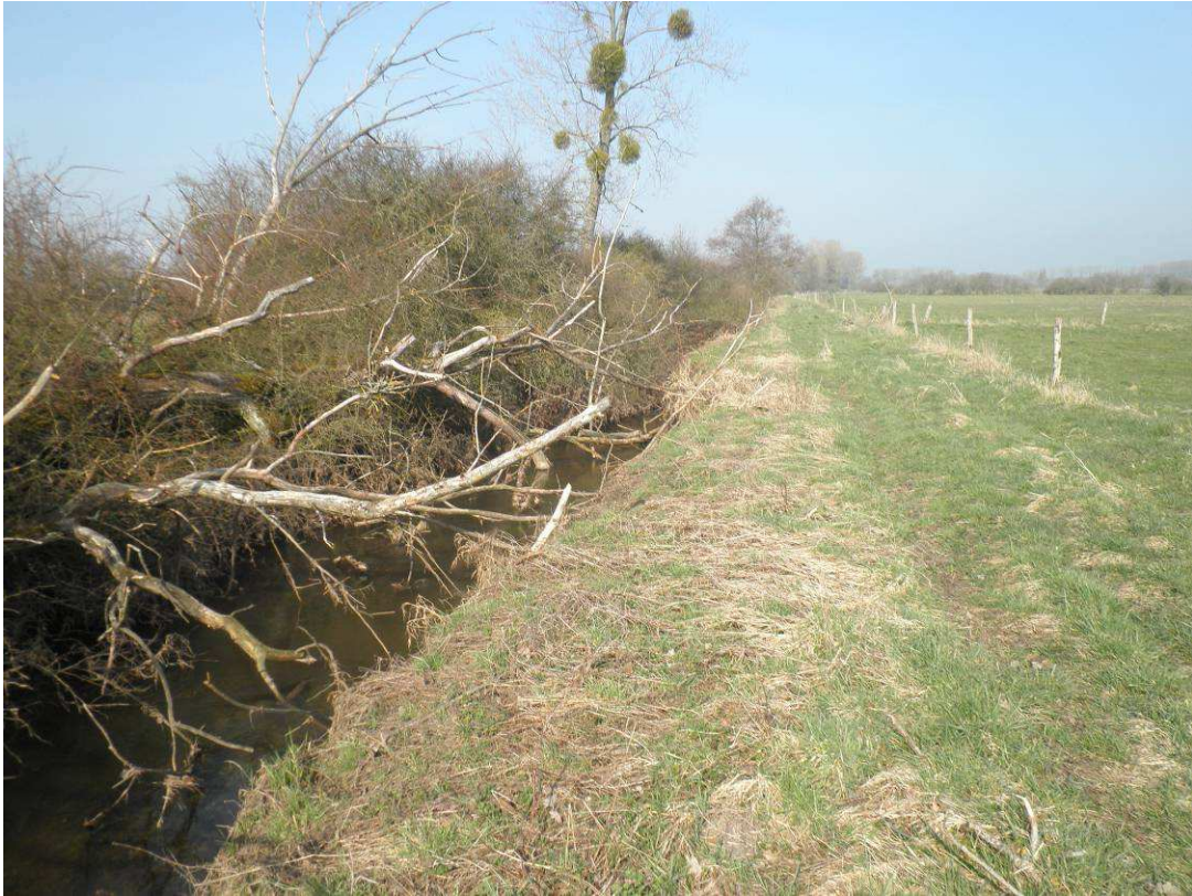
Peupliers riverains du cours d'eau tombés pendant l'hiver 2010.