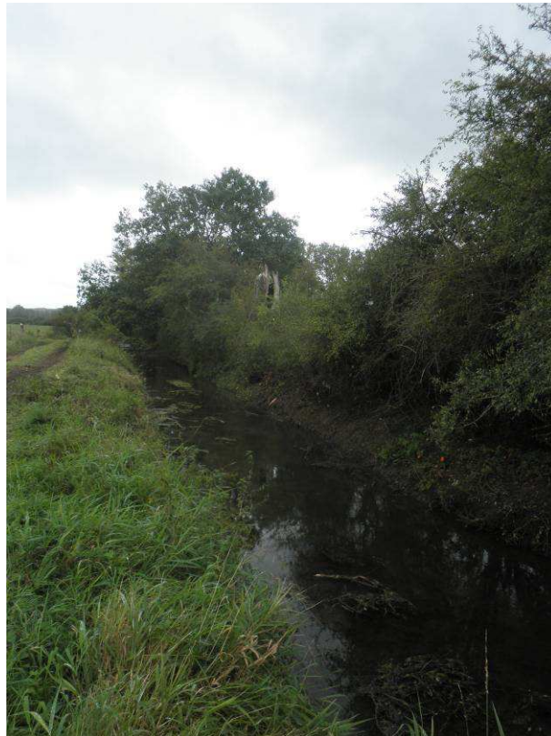
Coupe et extraction des arbres ainsi que des quelques buissonnants présents.