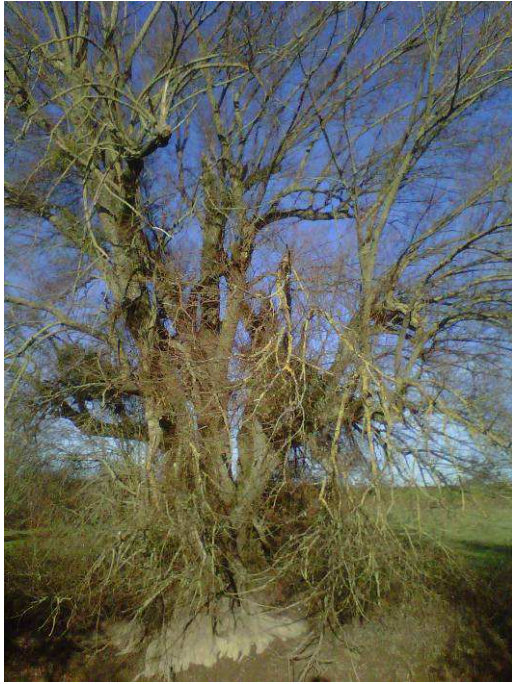
Présence de saule important avançant sur le lit de la rivière.