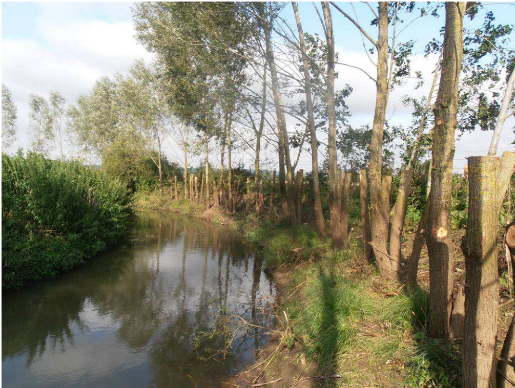
Secteur dénudé en 2002. Mise en place de clôture et bouturage. Intervention en 2014 : coupe de sélection des sujets bouturés avec maintien soit de têtard, soit de haut-jet.