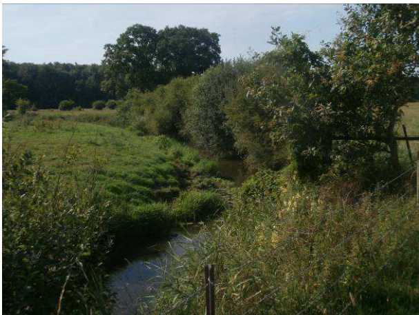
Végétation buissonnante recouvrant le lit de la rivière.