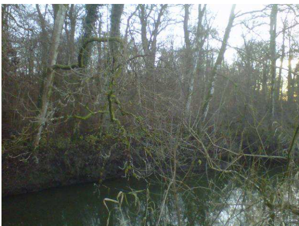
Présence de frênes inclinés sur la rivière menaçant de chuter.