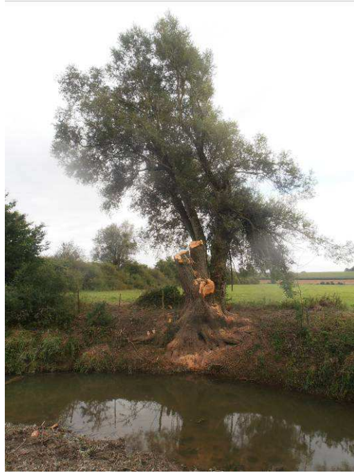
Coupe du saule en têtard.