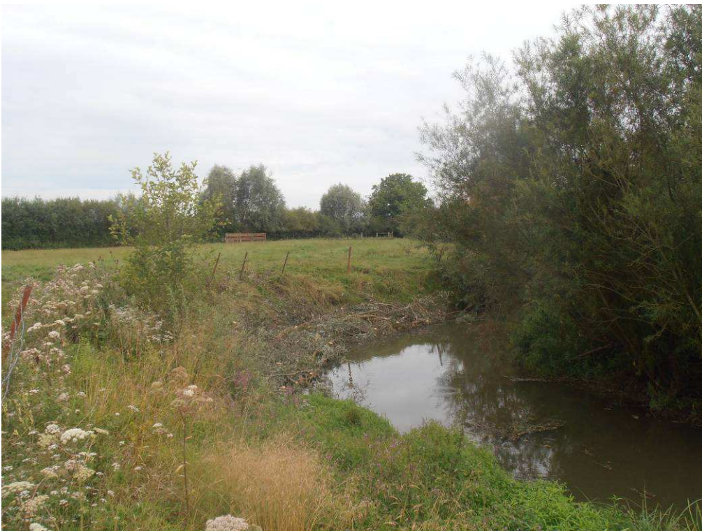
Réalisation d'un peigne afin de limiter la dégradation de la berge sur un secteur clôturé.