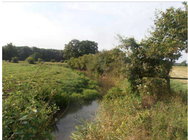
Coupe de la végétation avec maintien de quelques brins de petit diamètre sur la partie basse de la berge.