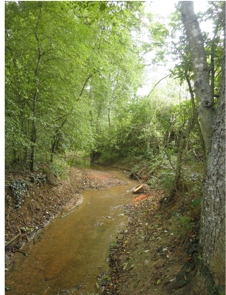
Coupe de la végétation implantée ou tombée dans le lit du ruisseau. Maintien d'une végétation rivulaire importante.