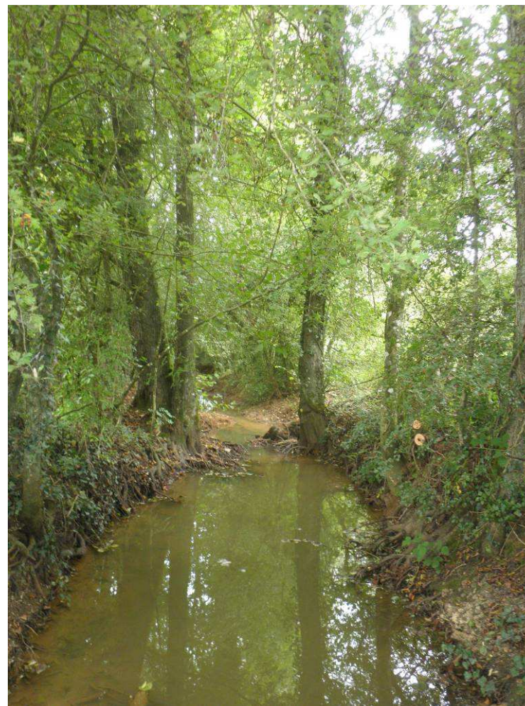
Coupe de la végétation buissonnante et maintien d'une végétation de haut-jet importante.