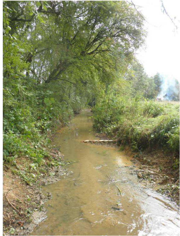
Réalisation d'aménagements rustiques (déflecteurs) sur des secteurs rectilignes afin de diversifier les écoulements.