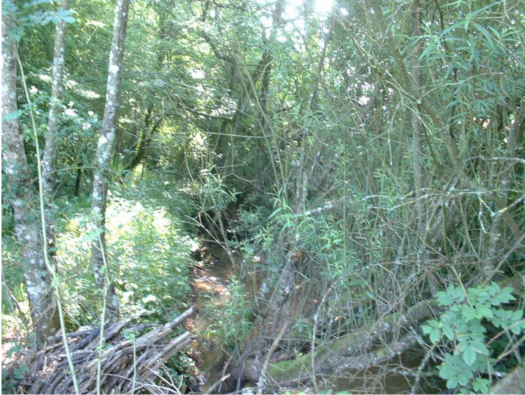
Constat avant intervention : Végétation fortement développée avec quelques sujets couchés dans le lit du ruisseau créant de légers embâcles.