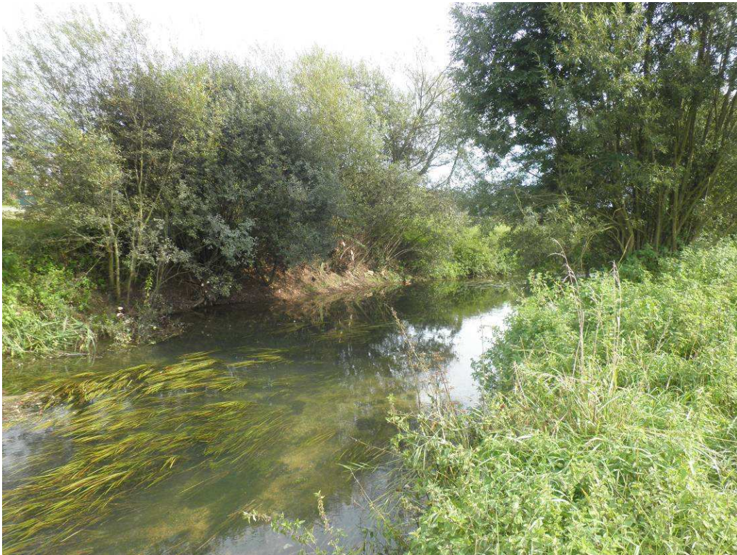
Coupe sélective des brins peignes