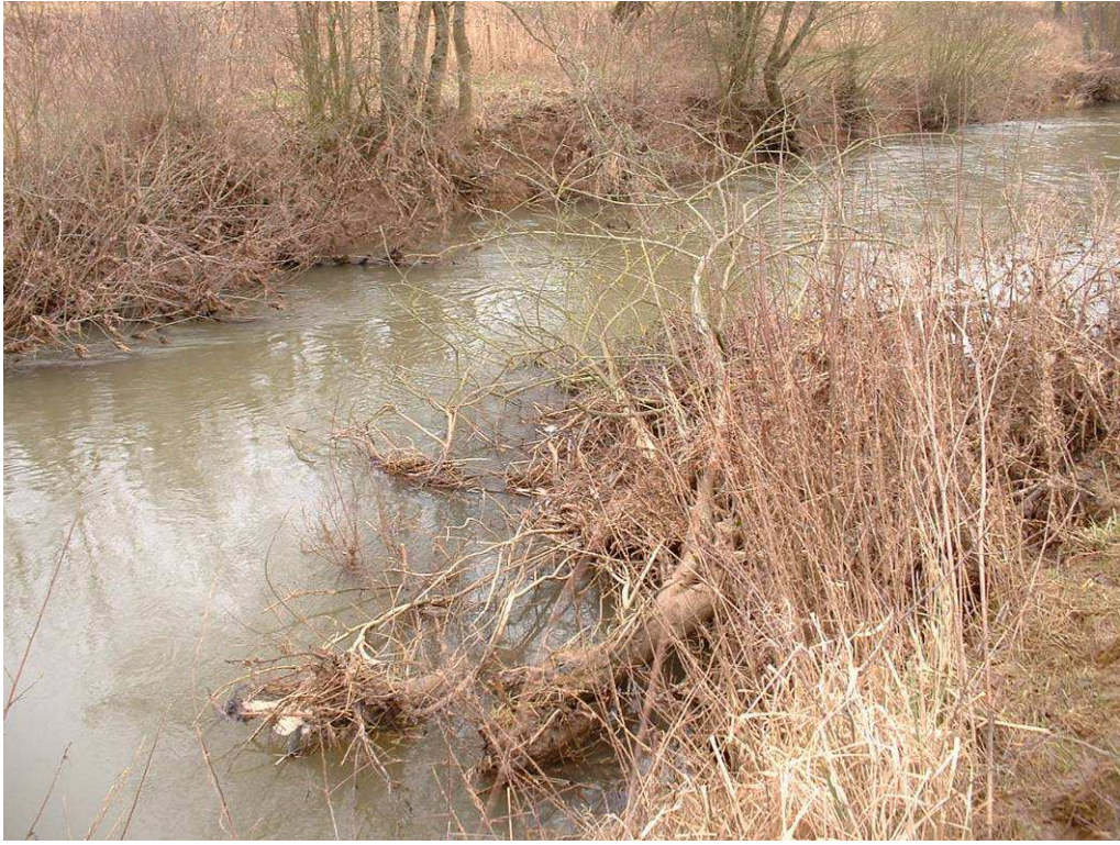
Début d'embâcle en berge convexe : accentue érosion berge concave