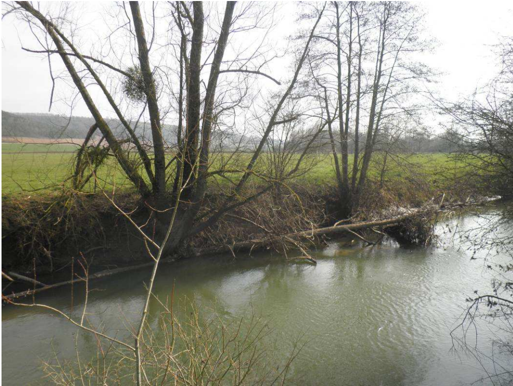
Cépée de saules à récupérer