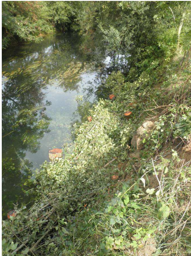
Mise en place de banquette peigne sur zone berge abrupte