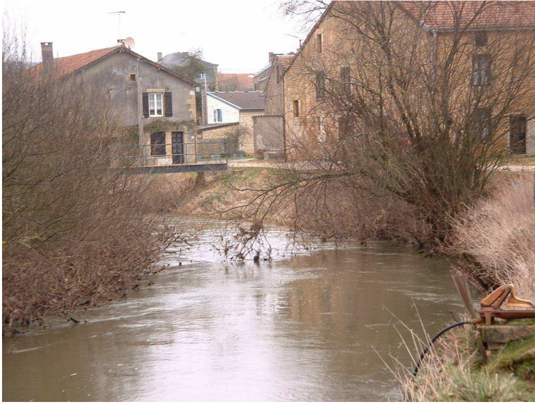
Saule buissonnant en amont de Connage en berge concave