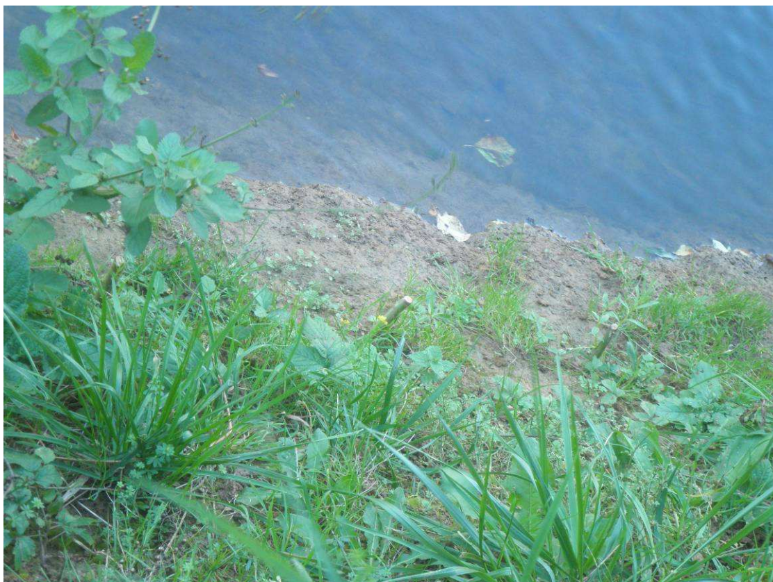
Mise en place de bouture sur berges dénudées