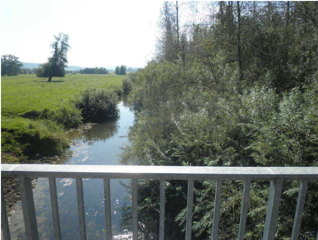
Cépée de saule en amont de Omicourt à recéper