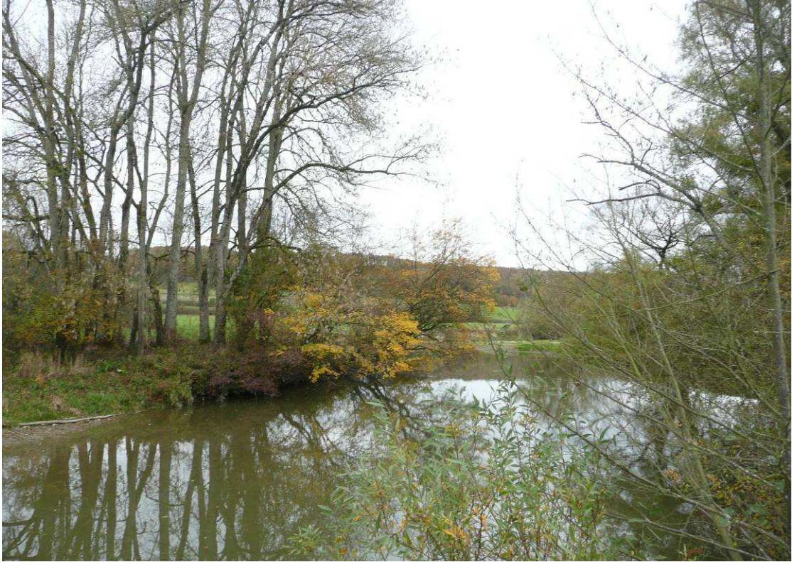
Avant travaux : Observation de végétation fortement inclinée menaçant de tomber sur la rivière