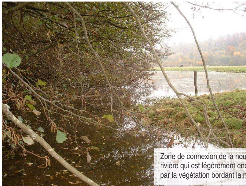
Zone de connexion de la noue avec la rivière qui est légèrement encombrée par la végétation bordant la noue