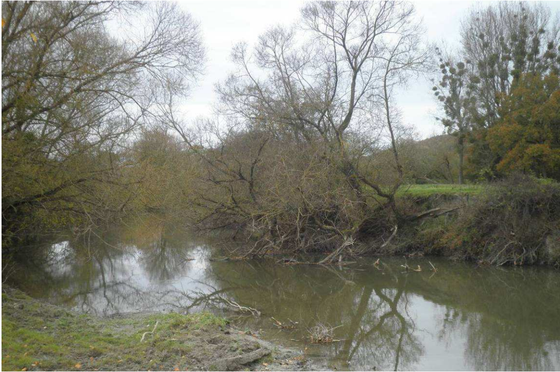
Avant travaux : Observation d'une cépée de saule fortement dégradée dont certains brins sont éclatés et tombés à la rivière