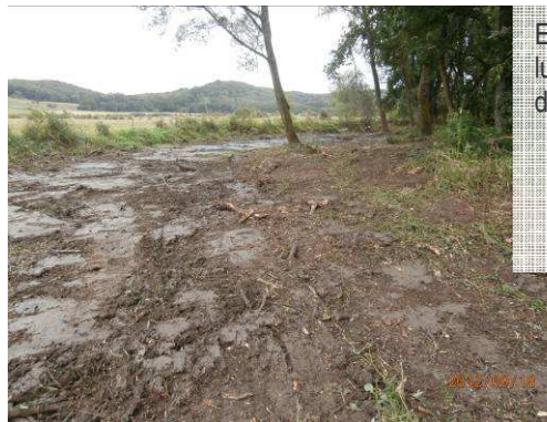
Extraction de la végétation arbustive et remise en lumière de l'atterrissement pour faciliter l'installation d'espèces herbacées.