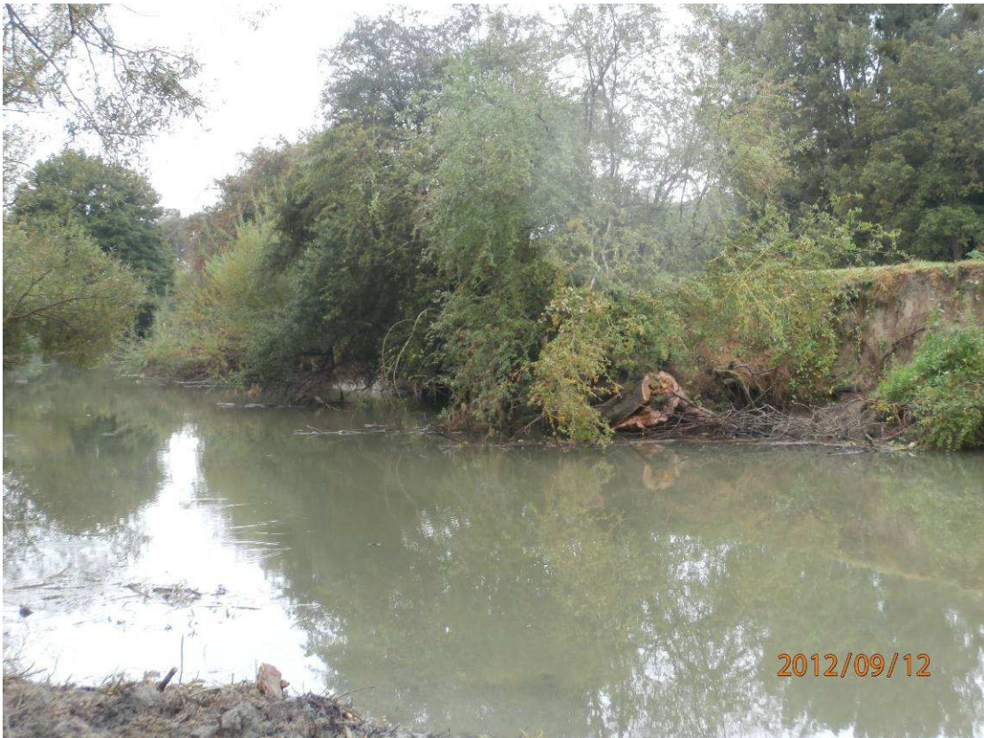
Après travaux : Coupe et extraction de la cépée