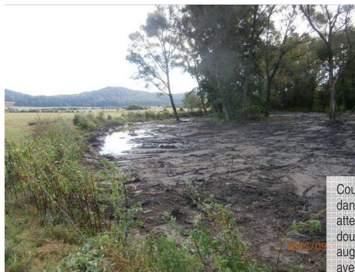
Coupe et extraction des saules tombés dans la noue. Réouverture de la partie atterrie et talutage des berges en pentes douces vers l'intérieur de la noue augmentant ainsi la zone de contact avec l'eau lors des périodes de crues.