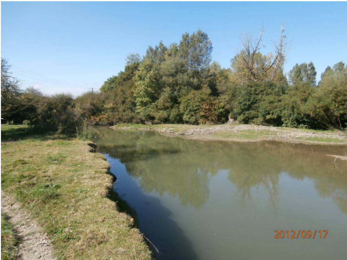
Après travaux : Coupe et extraction de la végétation buissonnante, remise en lumière d'un atterrissement