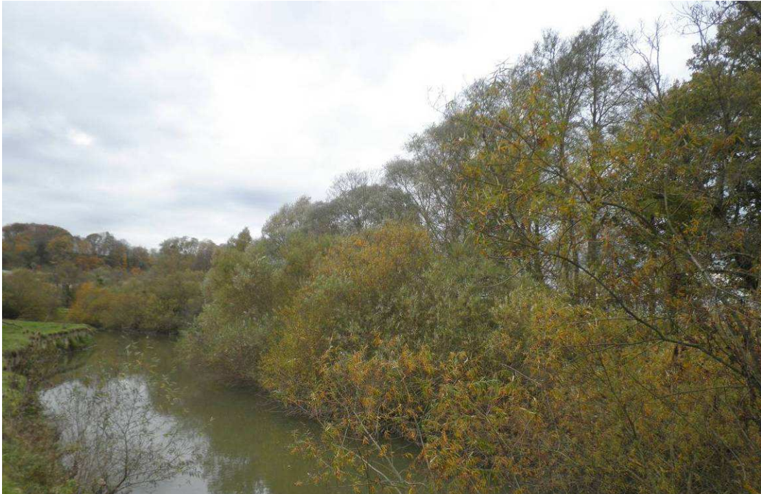
Avant travaux : Végétation arbustive importante recouvrant fortement la rivière