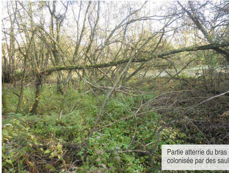
Partie atterrie du bras mort et colonisée par des saules.