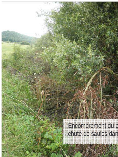
Encombrement du bras mort suite à la chute de saules dans la noue.