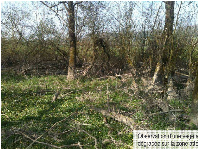
Observation d'une végétation arbustive fortement dégradée sur la zone atterrie de la noue.