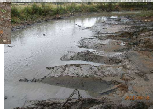
Création d'encoches dans le chenal périphérique de la noue, augmentant la diversité du milieu