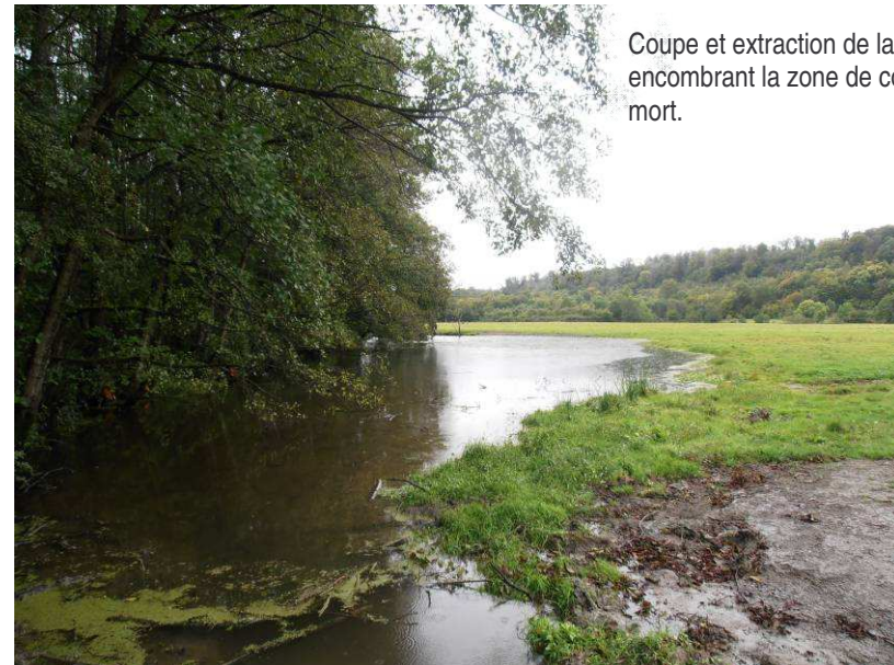
Coupe et extraction de la végétation basse encombrant la zone de connexion du bras mort.