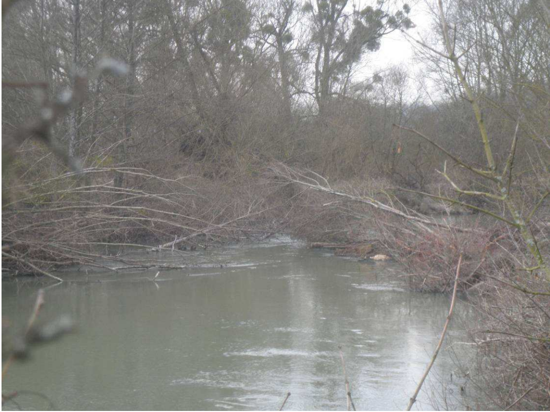
Observation d'un embâcle suite à la chute de plusieurs arbres dans la rivière.