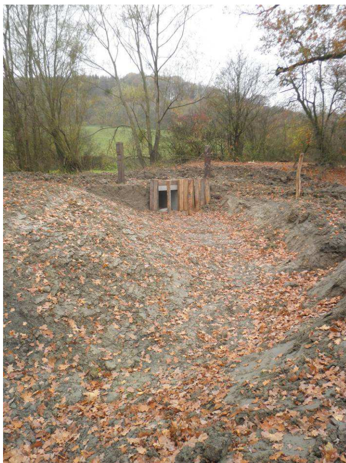
Limitation du passage des animaux et des engins par installation d'un pont cadre et d'une clôture au niveau de la zone de connexion.