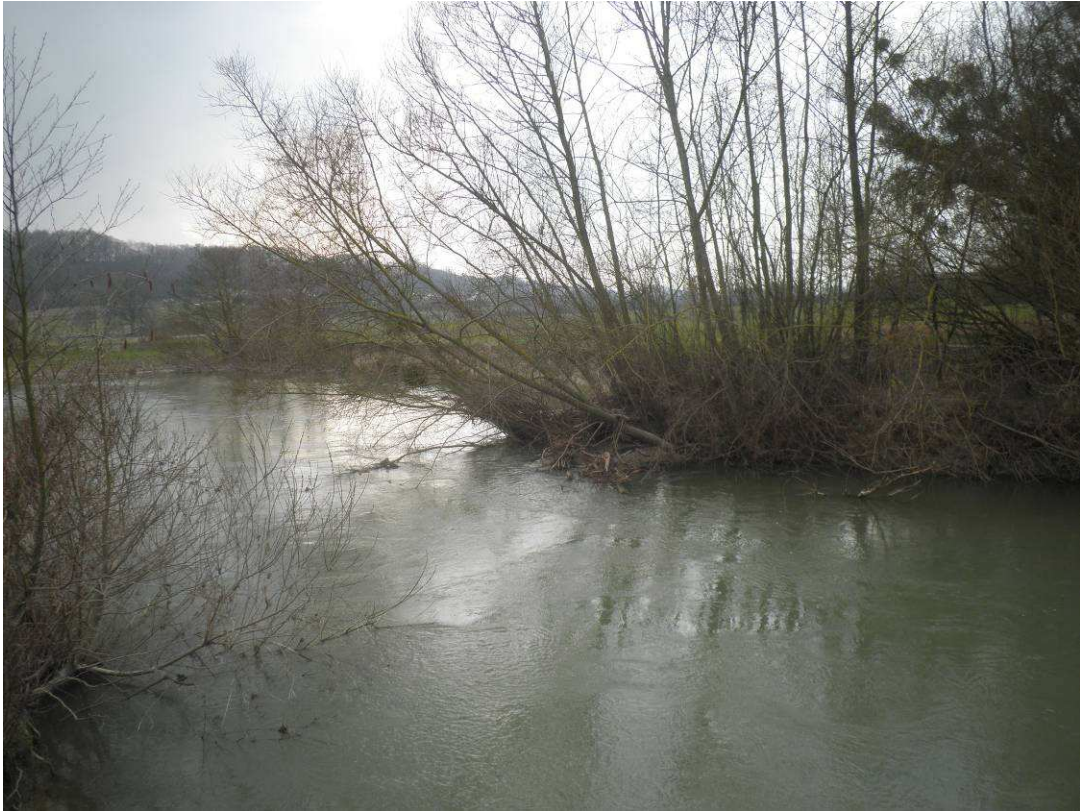
Cépée de saules fortement inclinée dans la rivière créant ainsi une zone de remous en amont et augmentant les risques d'encombres.