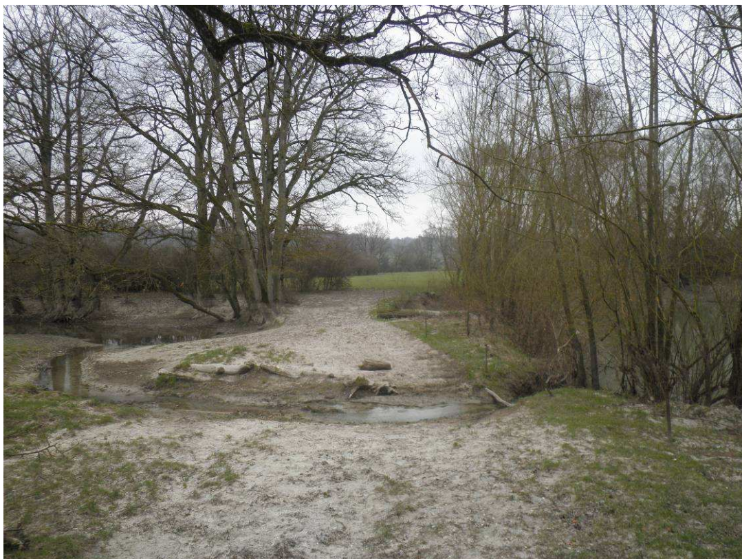
Zone de connexion de l'annexe. Passage à gué pour les animaux ou les engins pour accéder au reste de la parcelle.