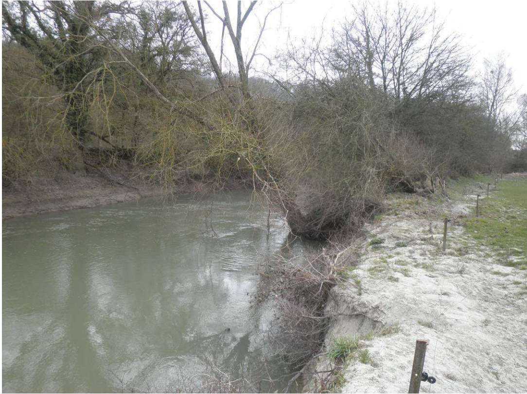
Observation d'un saule fortement avancé dans le lit de la rivière risquant de tomber emportant la souche.