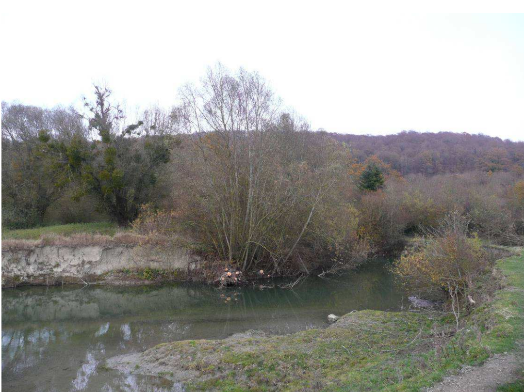
Coupe des brins les plus inclinés vers le cours d'eau et dégagement de la rivière.