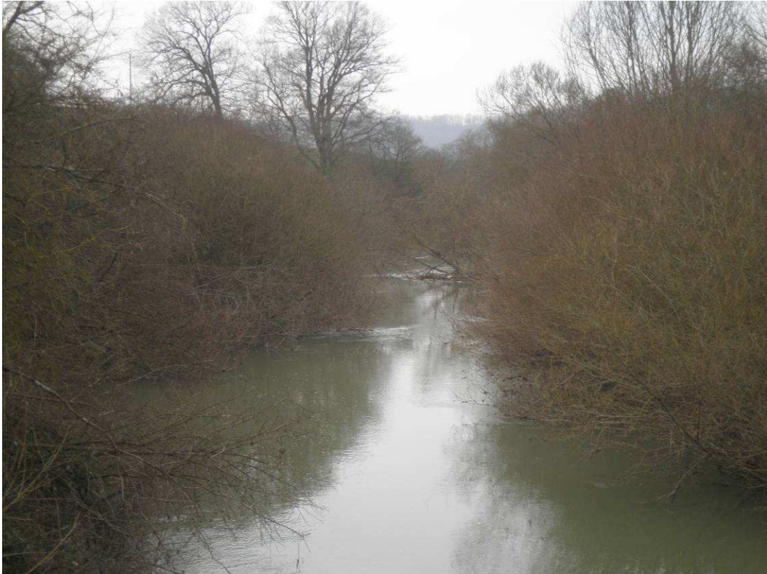
Observation de l'avancement des saules buissonnants sur la rivière.