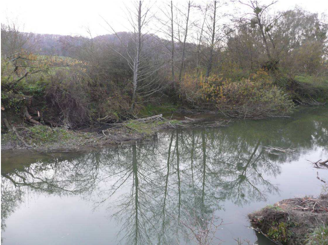
Retrait de l'embâcle par coupe des arbres couchés dans la rivière.