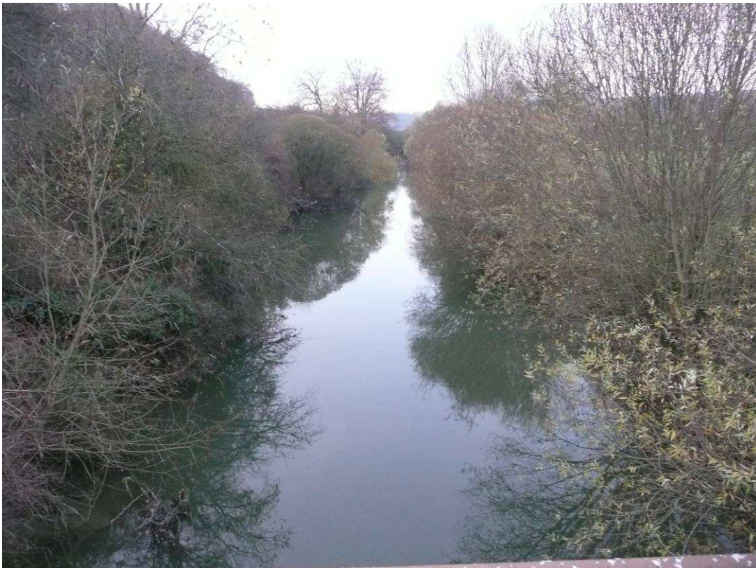
Maintien d'une végétation le long de la rivière et réouverture du lit par coupe sélective des plus gros brins de saules.