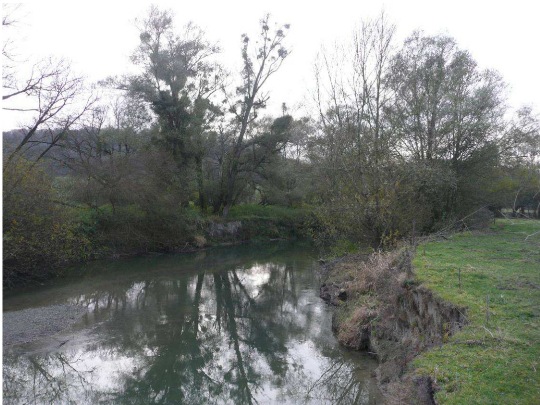
Coupe et extraction du saule.