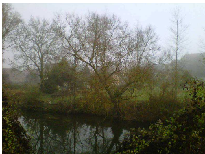
Saule fortement incliné sur la rivière.