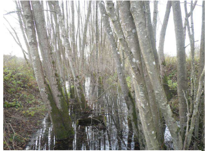
Développement important de végétation dans le lit du bras mort. Coupe et extraction afin de remettre en lumière et faciliter le développement d'une strate herbacée.