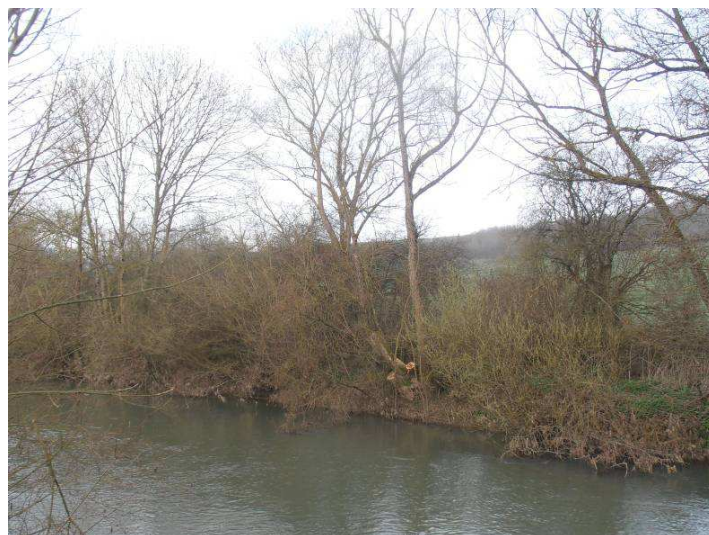
Coupe des sujets le plus menaçants, maintien de la végétation basse.