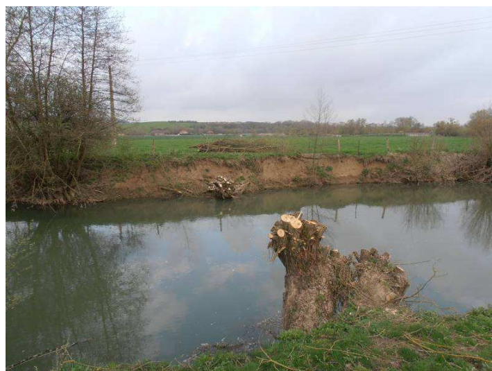
Coupe des sujets inclinés pour éviter basculement dans la rivière.