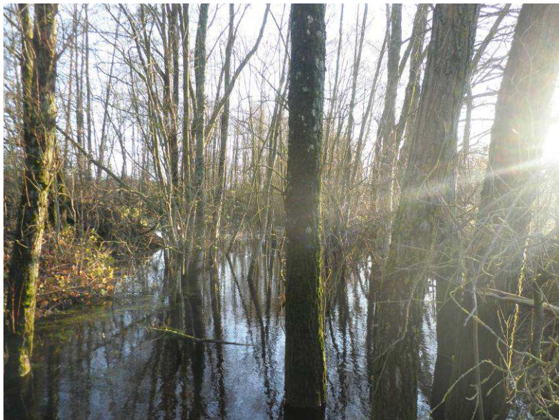
Développement important de végétation dans le lit du bras mort Coupe et remise en lumière de l'annexe.