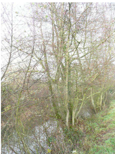
Cépée développée à reprendre (coupe des plus grosses sections afin de délester la cépée).