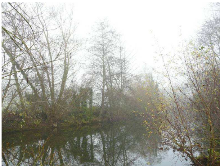
Cépées de saules fortement développées et aulnes malades risquant de tomber dans la rivière.