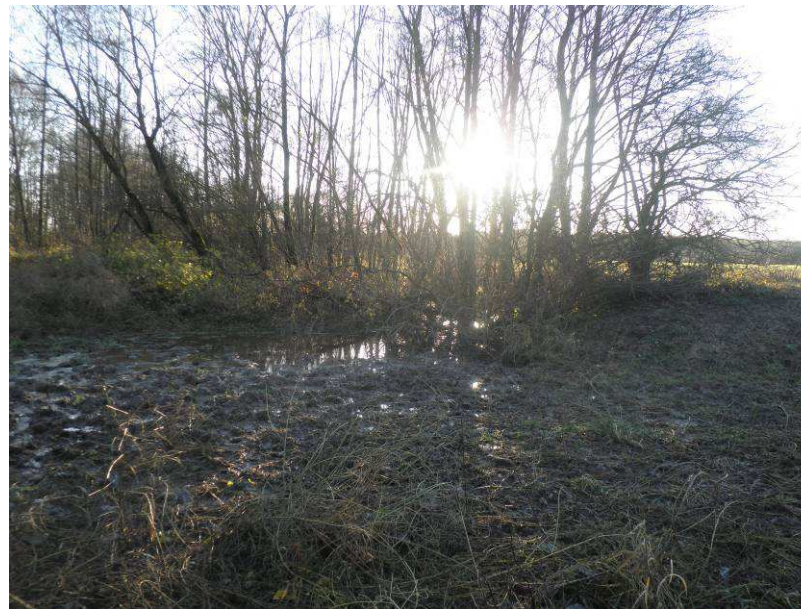
Connexion avec la rivière perturbée. Restauration de la connexion avec création d'un chenal d'écoulement.