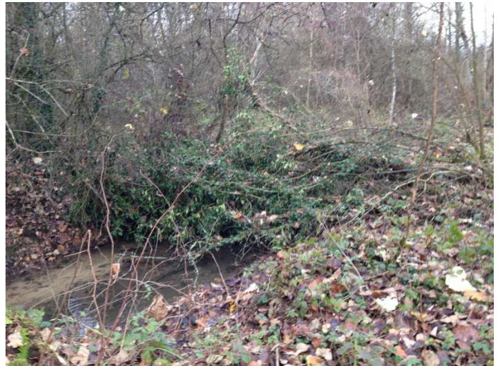
Présence de multiples embâcles dans le lit du ruisseau