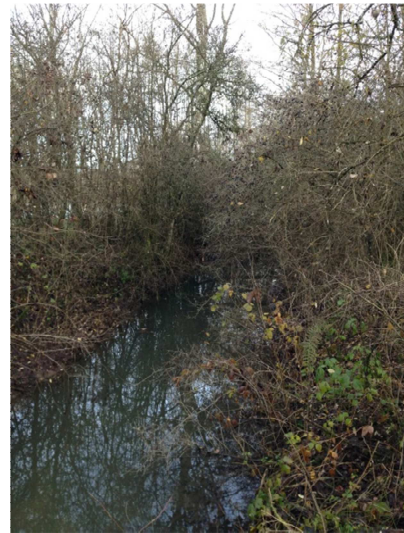
Végétation buissonnante vieillissante et ayant tendance à retomber dans le lit créant des encombres à l'écoulement.