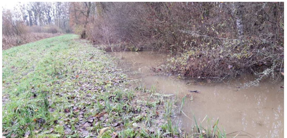
Présence de barrages de castor ayant une influence sur le régime des eaux et un effet de colmatage sur la partie amont. Le ruisseau ne présente plus les faciès d'écoulement d'un ruisseau de 1 ère catégorie et a tendance à dégrader l'état du chemin riverain