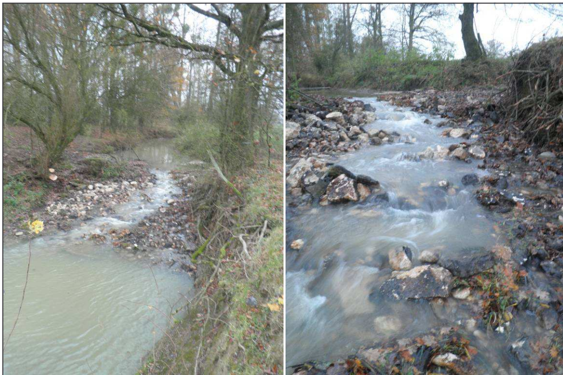
Allongement du seuil et création de fosse facilitant le franchissement des poissons.