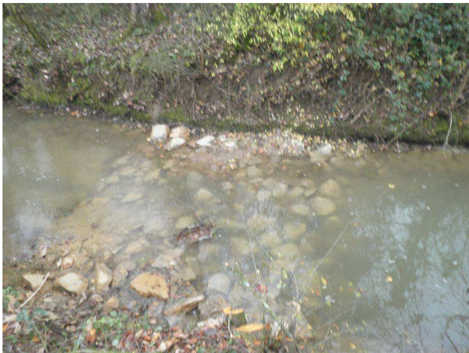
Extraction des têtes de peupliers et réalisation d'un seuil de fond