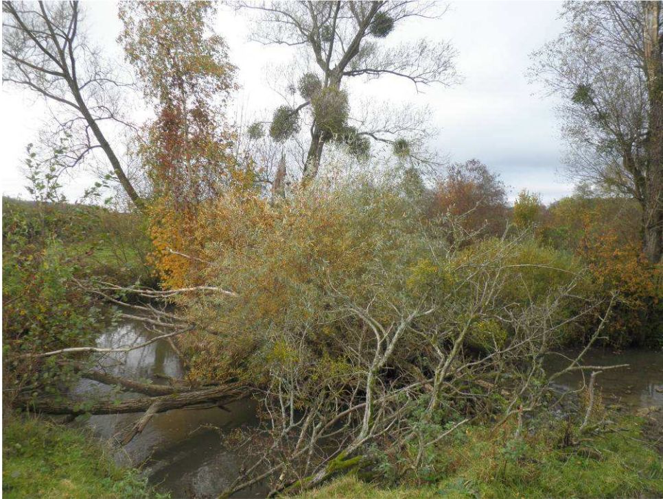
Vieux saule têtard à restaurer