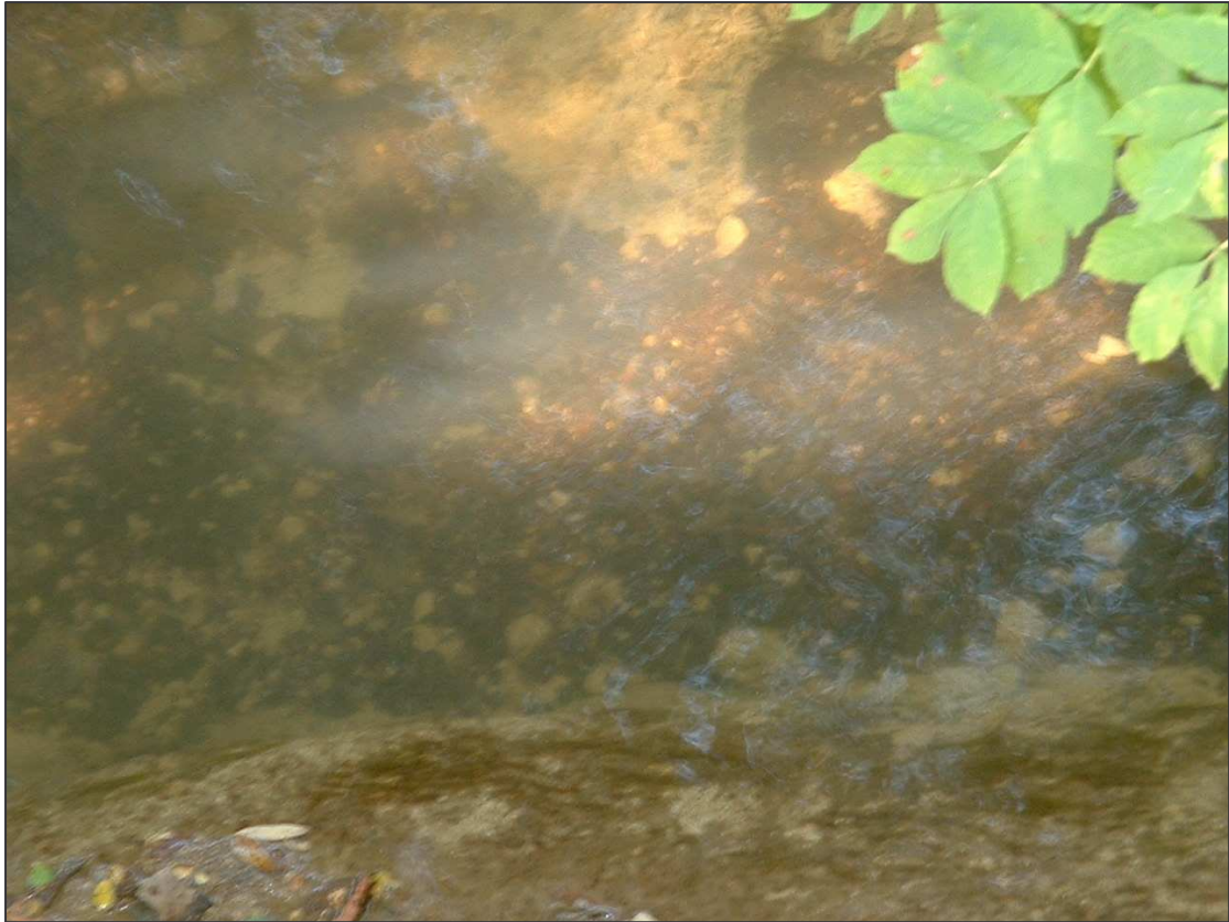
Substrat disparu, la rivière coule sur la roche mère.