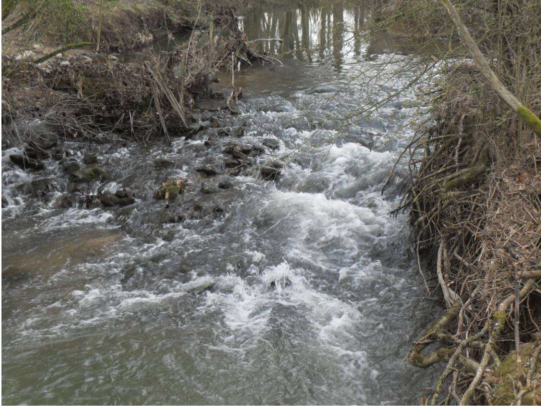
Présence d'un seuil servant de passage à gué mais quasi-infranchissable pour la faune piscicole.