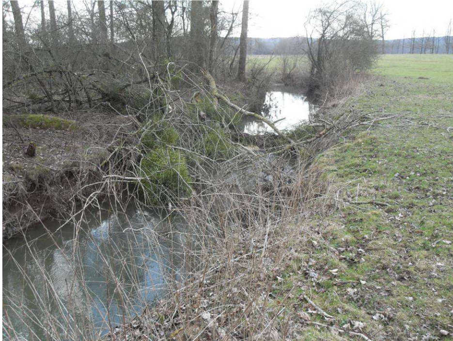
Têtes de peupliers tombées dans le lit de la rivière