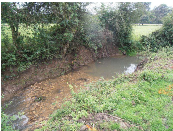
Avant : Cépée déracinée et tombée dans la rivière limitant l'écoulement superficiel et créant un embâcle Après : Extraction de l'embâcle et création d'un radier