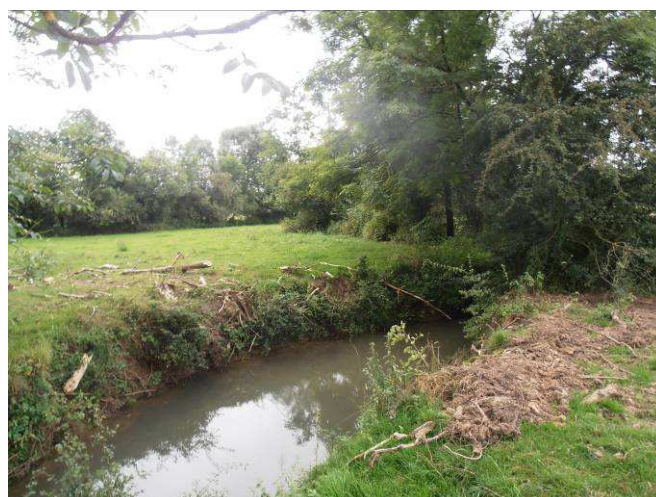
Avant : Peuplier vieillissant déraciné et tombé dans la rivière suite à des épisodes venteux (création d'encombres) Après : extraction du peuplier et remise en place de la souche sur la berge.