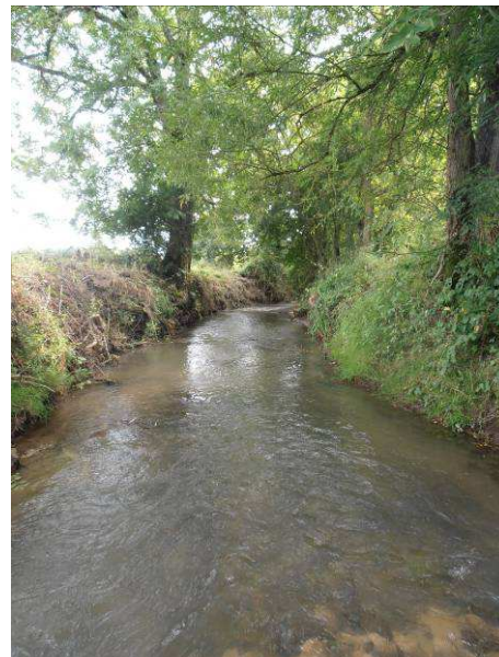
Avant : Végétation arbustive fortement développée recouvrant le lit de la rivière Après : Coupe sélective de la végétation et dégagement du lit de la rivière