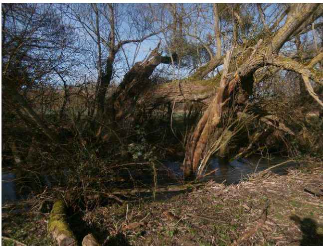
Vieux saule repris en têtard