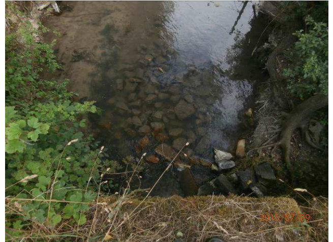
Aménagement du radier aval du Pont de pierre