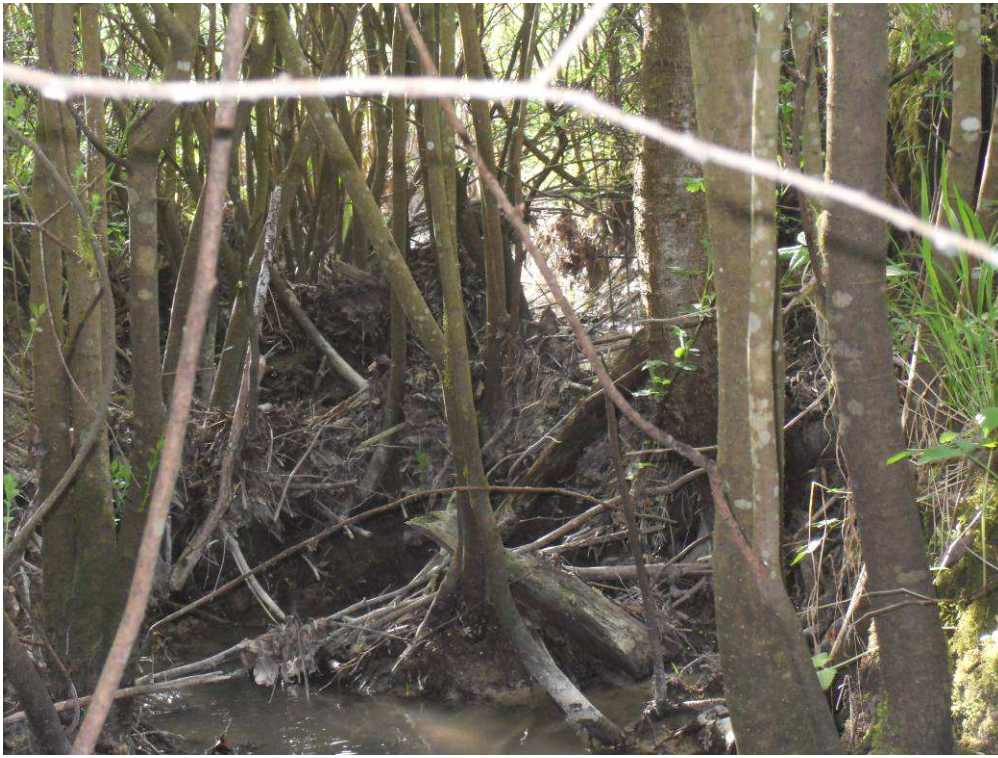
Long du chemin AF avant et après travaux