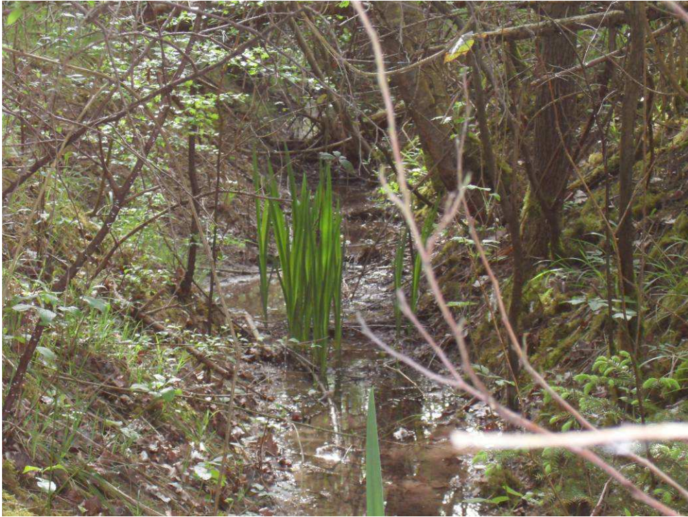
Fossé parallèle à celui de Beaumont avant et après travaux