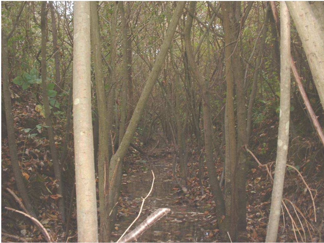
Fossé vers Beaumont vue de la buse avant et après travaux