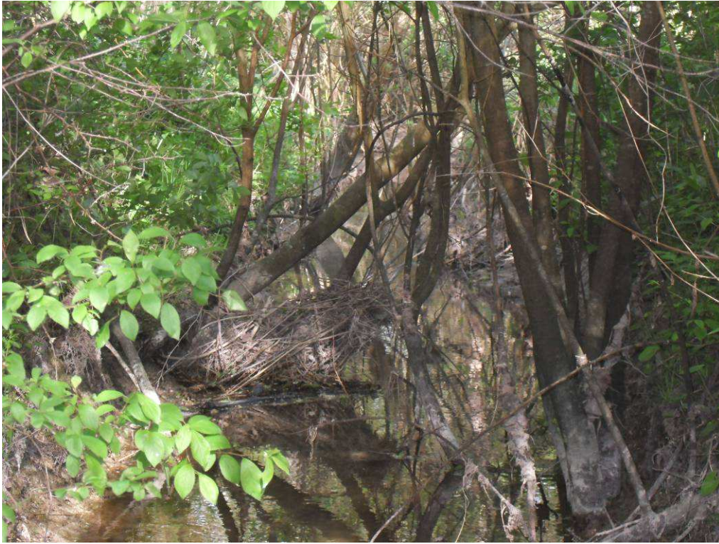
Traversée de première zone boisée avant et après travaux