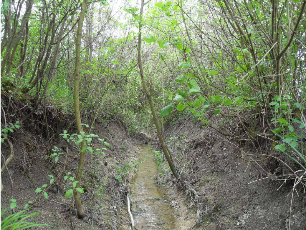
Juste Amont Route de Givry Avant et après travaux