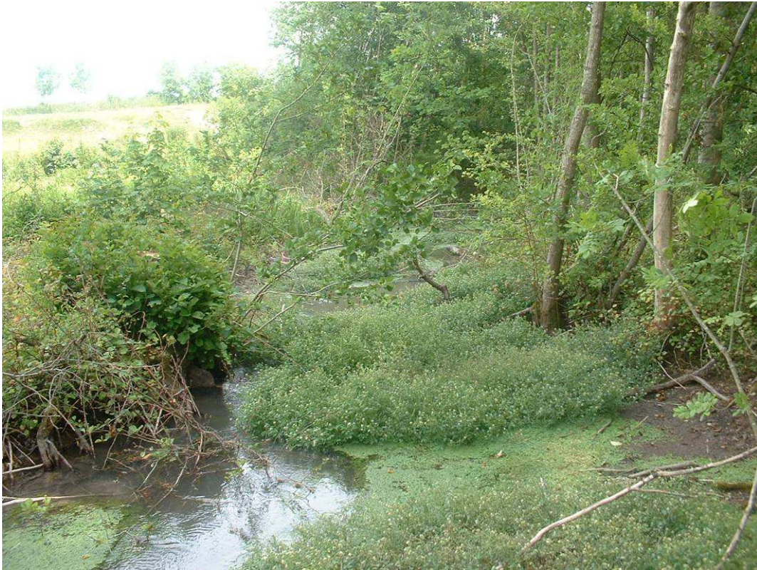
Sortie du marais coupe de peuplier en rive D : Lit ensasé et envahie par le faux cresson et callitriche