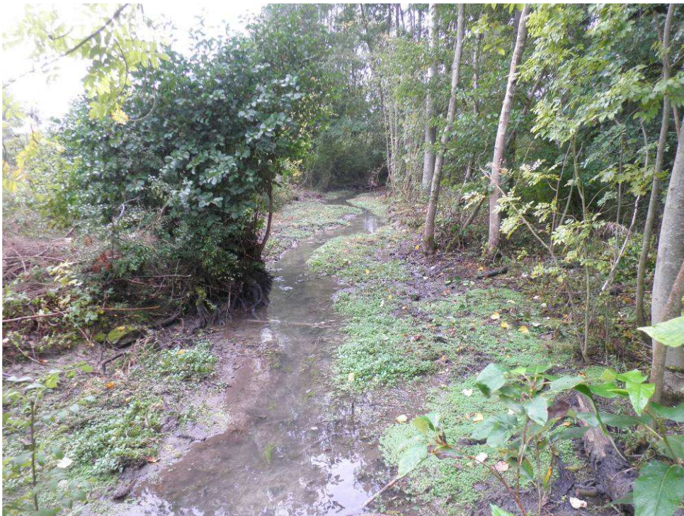
Désencombrement du lit et utilisation du Faux cresson pour réaliser des banquettes d'étiage