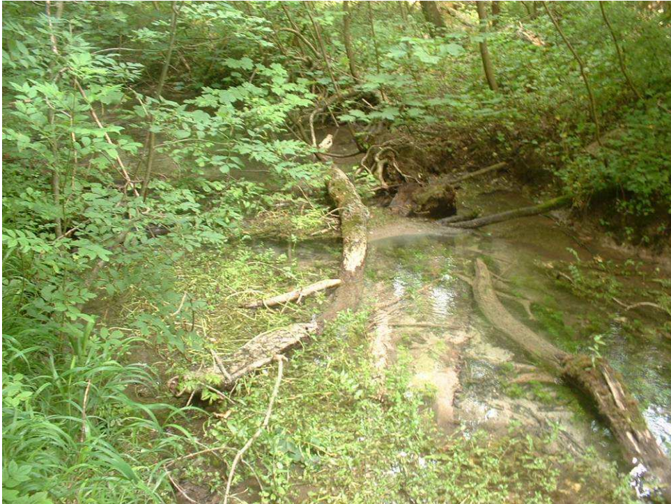
lit encombré et élargit 4 à 5 m : envasement Embâcle à traiter partiellement

Objectif : Tester mise en place de banquette en peigne végétale et travailler sur le positionnement des embâcles