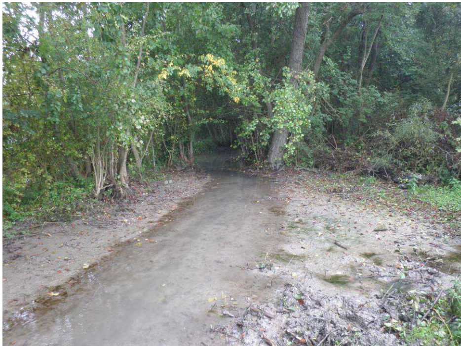
La gestion des embâcles a permis au lit d'étiage de se recentrer, « l'autocurage » qui va s'effectuer l'hiver va recreuser un lit d'étiage naturellement.