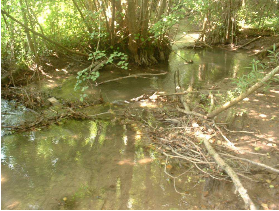
Sous le Village : lit très large, encombré, plusieurs barrages anthropiques et naturels avec envasement important