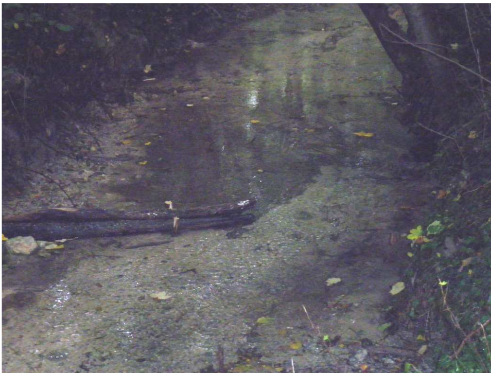
Défecteur face souche d'aulne