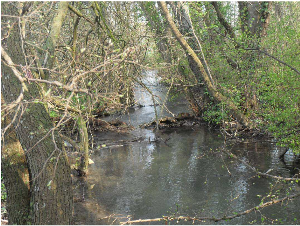
Lit très encombré, la lame d'eau se disperse même en période d'étiage Envasement malgré une zone à courant