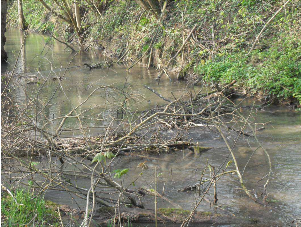
Lit encombré et large 5 –6 m, de nouveau envasement : Traiter l'embâcle partiellement