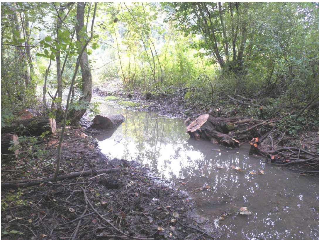
Arbre mort demi déraciné, préserve la souche et utilise une partie du tronc pour faire un déflecteur