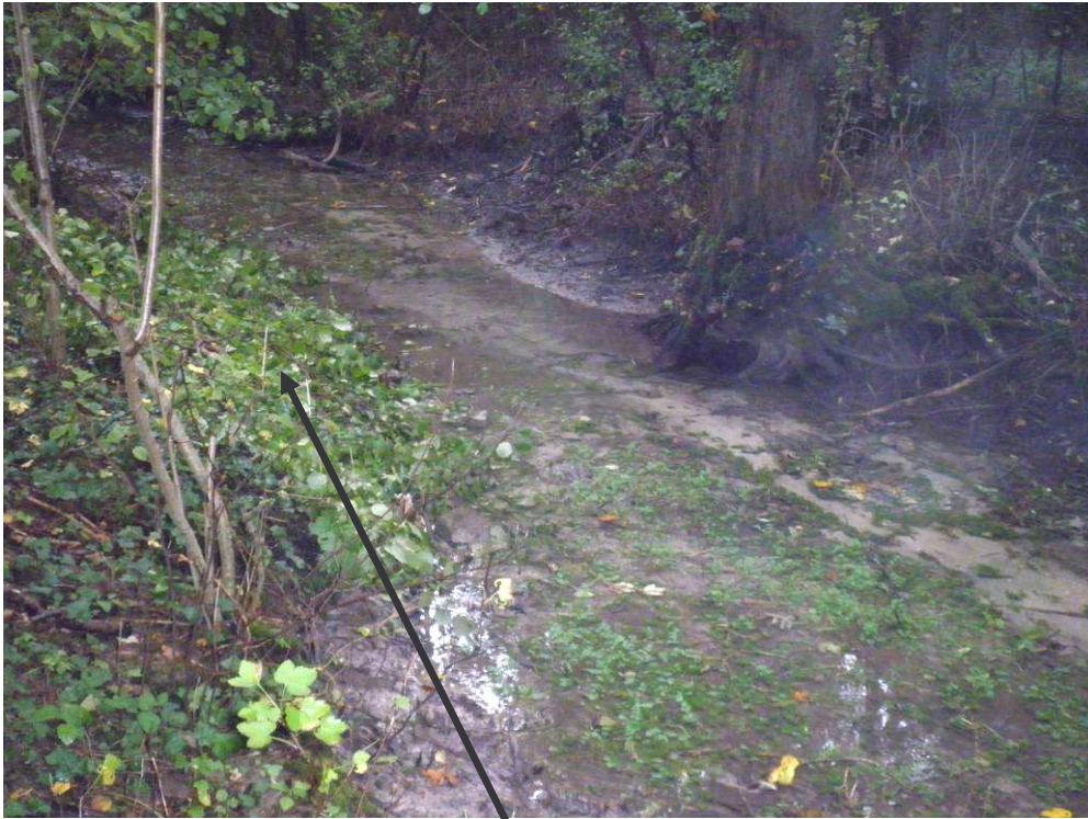
Banquette végétale en rive gauche pour resserrer le lit d'étiage