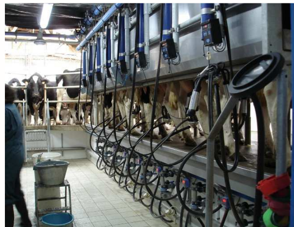
Deux ensembles d'exploitations comparables mais équipés différemment pour la traite

* Le groupe d'élevage sans robot de traite sera appelé groupe ou lot témoin dans la suite de ce document.