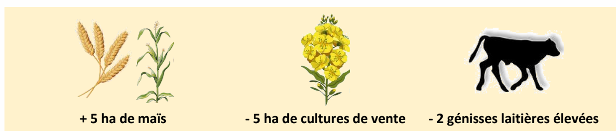
Tableau 4 : Évolution sur l'utilisation des surfaces fourragères et résultats économiques attendus, en comparaison avec la situation à court terme